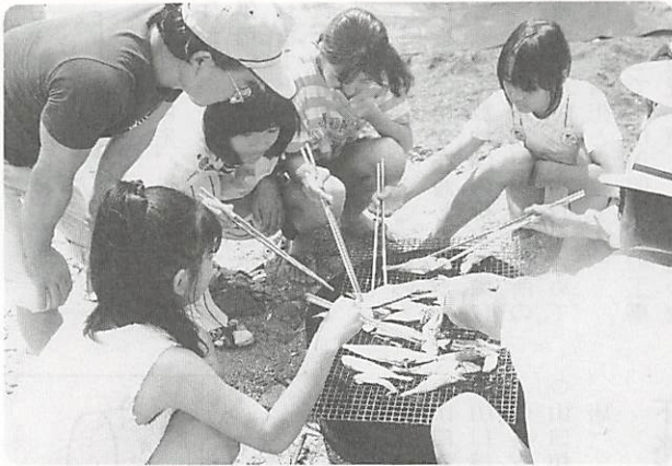
△秋穂二島の夏を満喫

8月4日から5日間、豊田市美里地区の中学生6人が、中学生親善交流事業で秋穂二島地区を訪れた。海辺でシャコをとったり、子ども会のキャンプに参加したり、秋穂二島地区ならではの生活を体験、ふれあいを深めた。