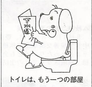
トイレは、もう一つの部屋

山口市の公共下水道の施工区域および認可拡大区域は次のとおりです。認可区域は、今後、年次計画により整備を進めます。下水道の果たす役割は、①