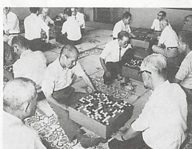
老人クラブ囲碁将棋大会 （8月19日・市福祉センターで）

的につくられた会員組織の団体です。老人クラブでは、社会奉仕活動・教養趣味講座の開催・スポーツの振興など、幅広い活動がされています。対象となる方は60歳以上です。入会を希望される方は公民館から出張所に申し込みください。 単位老人クラブには、それぞれの行事が計画されていますが、山口市の老人クラブの連合組織となります（財）山口市老人クラブ連合会では、次のような行事が実施、計画されています。 ○山口市福祉の市 ○姉妹盟約4県老人クラブ交歓大会 ○ゲートボール大会 ○単位