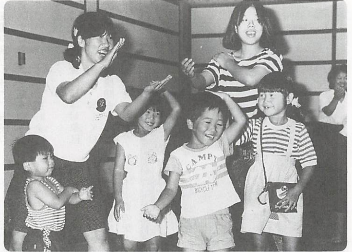
△親子で楽しいひとときを

8月4日から5日間、豊田市美里地区の中学生6人が、中学生親善交流事業で秋穂二島地区を訪れた。海辺でシャコをとったり、子ども会のキャンプに参加したり、秋穂二島地区ならではの生活を体験、ふれあいを深めた。