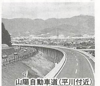
山陽自動車道(平川付近)

○申し込み 9月14日までに、往復はがきに住所、氏名、年齢、電話番号、参加希望日を記入し、市広報課(〒753 山口市亀山町2-1 ☎22-4111)へ