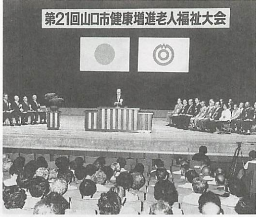
昨年の市老人福祉大会

老人憩いの家、1回限り無料です 市では、9月1日から1か月間、60歳以上のお年寄りを対象に寿泉荘、嘉泉荘、潮寿荘を1回限り無料で開放します。ぜひ、ご利用ください。