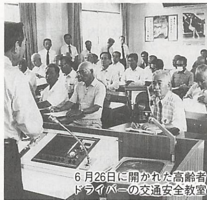
6月26日に開かれた高齢者ドライバーの交通安全教室

最近、お年寄りの交通事故が増加しています。県民一人ひとりがお年寄りの交通安全に対する理解と認識を深めるとともに、お年寄り自らの交通安全意識の高揚と交通事故の防止を図りましょう。