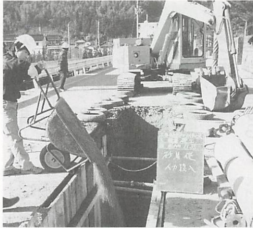
山口高校裏（糸米二丁目）での公共下水道の汚水管理せつ工事（昨年11月）

山口市の公共下水道は、昭和48年度から着工し、62年度までに認可区域6百56haの内4百86haを整備し、63年3月に新たに7百19haの認可を加え、千三百75haに拡大変更し