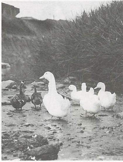
下水道の整備で、川には清流がよみがえり、魚や鳥にも住みよい生活環境となります。(写真は、榎野川で)

これから先、皆さま方の居住地域の下水道整備が進み、供用(処理)開始の告示がされますと、ご家庭では排水設備(便所の水洗化)工事が必要となります。