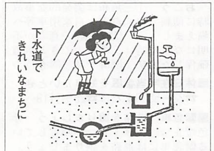
下水道で きれいなまちに