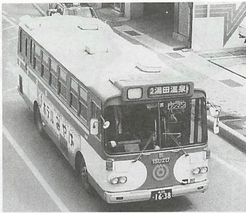
市民の足、市営バス

割安の回数券を発売しています 山口市営バスでは、20券片相当額で23券片つづりの普通回数乗車券と、20券片相当額で25券片つづりの通学回数乗車券を発売しています。買物、通勤等にご利用ください。詳しくは市交通局 (☎22-2555) へ