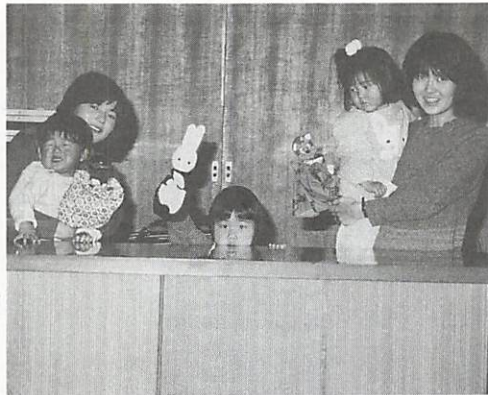
お母さんと一緒に人形劇(昨年12月、母親クラブ主催のクリスマス会で)

昔は、兄弟姉妹が多かった子供たちとの遊びを通して、子供同士で磨かれ、上から下に伝えられていたことが、