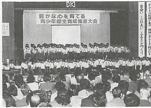
湯田中学校で行われた青少年健全育成推進大会(昨年10月25日)

県立山口図書館等は秋季資料点検のため、次のとおり閉館となります。 ○県立山口図書館・県点字図書館・県視聴覚センター音楽資料室⇒11月15日～24日 ○県文書館⇒11月15日～21日