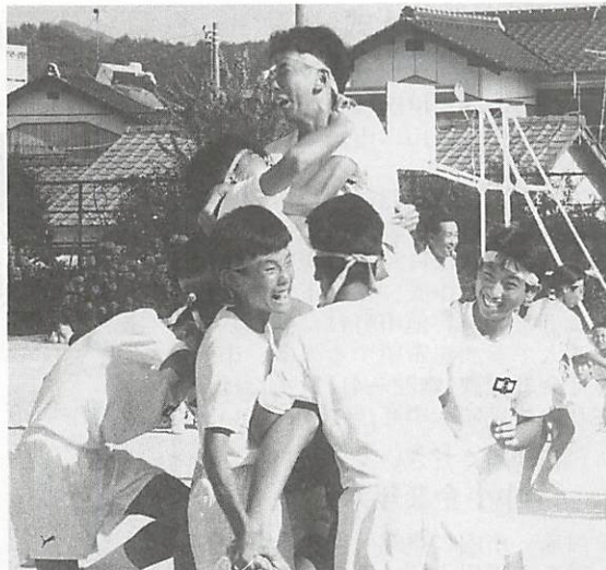
各自がそれぞれの役割をになって、チームに貢献。体育祭は、体力づくりに合わせ、思い出づくりの場（写真は、9月15日の白石中学校体育祭での騎馬戦）

11月は「全国青少年健全育成強調月間」です。家庭・学校・地域が一体となって、地域ぐるみで、青少年の健全な育成を図ってゆこう、青少年自身も積極的に、地域社会の一員として、地域社会の運動に参加してゆこうという全国的な運動です。