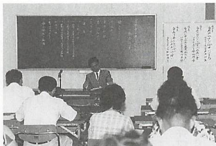
白石地区青少年健全育成協議会の総会(7月6日、白石公民館で)

活動内容としては、青少年健全育成のための諸活動で、地域によって多少の差はありますが、三世代ゲートボール大会、親子ハイキング、史跡