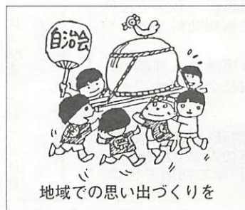
地域での思い出づくりを

すでに各町内会にお願いして、実施計画を立ててもらっています。昨年は、2百20余町内で実施され、1万5千余人が参加されました。