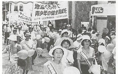
青少年健全育成の街頭パレード(7月1日、市民会館→商店街→市役所)

ラブ連合会、市スカウト協議会、市ガールスカウト育成協議会、市スポーツ少年団指導者連絡協議会、市公民館連合会、市教護連盟、吉南補導連盟、山口地区高等学校補導連盟、(幼)山口青年会議所、市民生児童委員協議会といった、教育機関、健全育成・非行防止を目的とした協議機関や育成団体が加わっています。 更に、県民運動地区推進委員、青少年指導員、少年相談員といった、各地区で青少年指導に携わつておられる方で、この市民会議が構成されています。