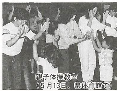
親子体操教室 (5月13日、県体育館で)