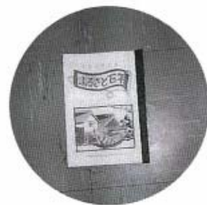
記念誌「ふるさと百年」 (切り絵は西村謙治さん)

「ふるさと百年」と題したこの本。まだきちんと製本されてはいませんが、中津江の生活改善実行グループの皆さんが、地域の人々の暮らしぶりを次代へ伝えようと編さんしているものです。