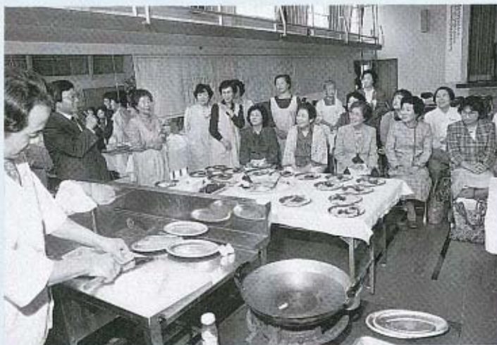
おいしいアトラクションでした