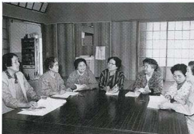
中津江生活改善実行グループの皆さん