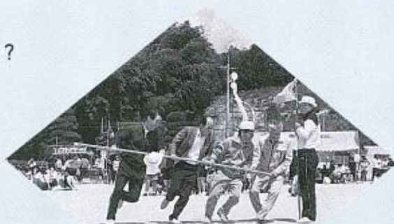
▲疲れるのは外側の人? 内側の人?