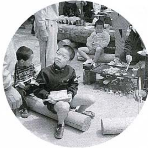
ほんぼら飯がおいしそう

好天に恵まれ、「石城山家族のつどい大会」が、四月二十九日(みどりの日)に、大和町の石城山青少年宿泊訓練所で行われました。