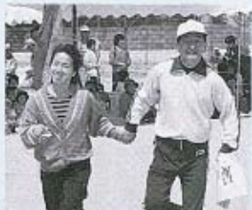
▲借り物競争、題は「髪の長い人」? ▼チビっ子たちも走る走る