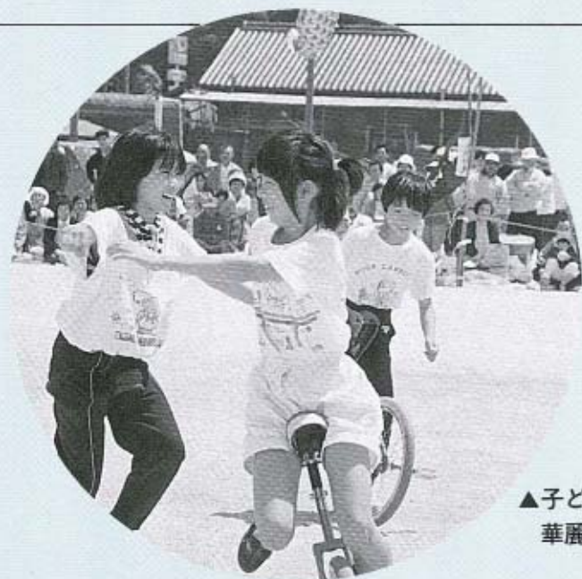
▲子どもたちが 華麗な演技を披露