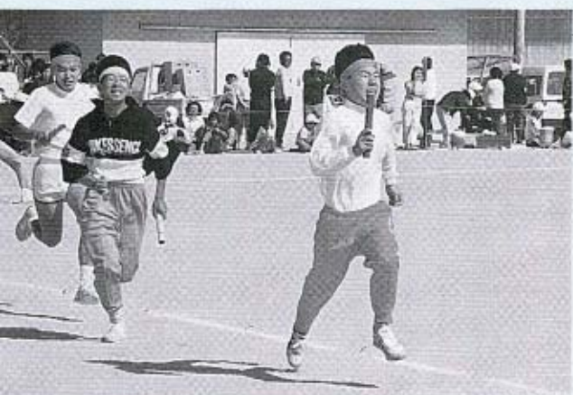
▲大会の花形は「地区別リレー」