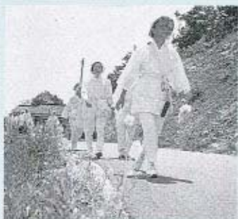
菜の花とお遍路さん

県内外から訪れた老若男女は、約2万人。昔ながらに歩く人、自転車でもわる人、車ですばやく巡る人と、思い思いの方法で霊場をまわっていました。