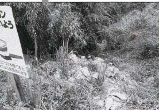
だれですか? ごみを捨てたのは

美しい自然に恵まれた秋徳町。しかし、ふと足もとに目を向ければ、ポイ捨ての空き缶、紙くずなどが散乱し、美観を損ねています。悪質なものは、目を覆いたくなるような多量のごみが、人通りの少ない場所に捨てられていることもあります。