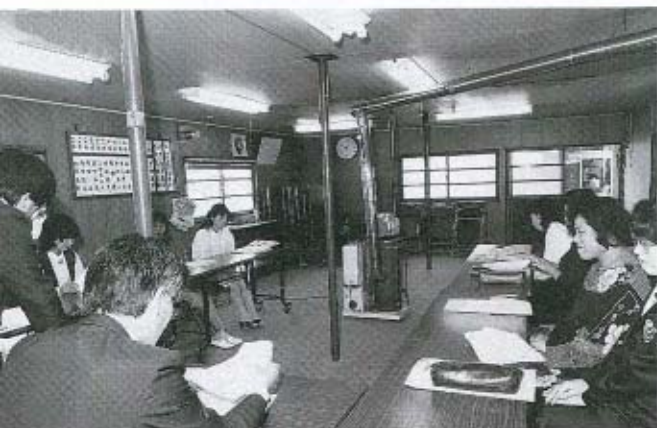
モニター会議中の皆さん