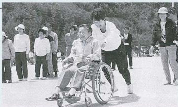
▲みんなの笑顔で盛り上がった大会