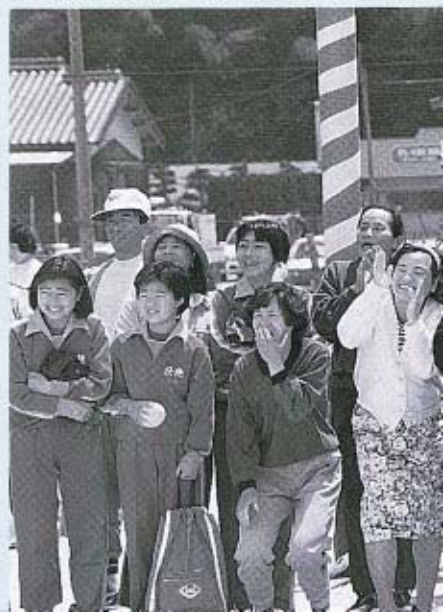
▼「がんばれ〜っ」応援もいっしょ