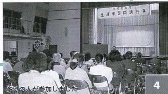
多くの人が参加しました

昨年から実施している公民館の学級・講座の総合的な開講式を、四月二十二日(土)に中央公民館講堂で実施しました。