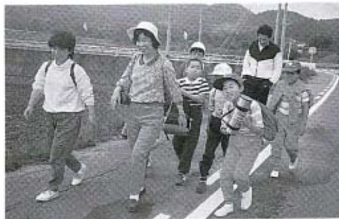
楽しい一日でした