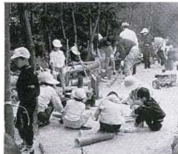
準備も楽しいものです

五月二十一日(日)、子ども会ハイキング大会が、草山公園を目的地に行われました。 当日は、天候が心配されましたが、予定どおり大海・秋穂両地区を出発し、草山で合流しました。この日は約五十人の参加があり、目的地では、綱引きや縄飛び、植物あてゲーム、宝さがしなどをして、楽しい一日を過ごしました。