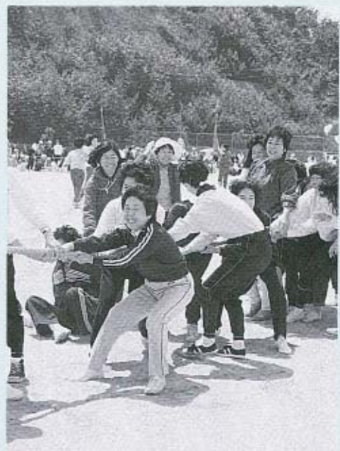
▲ウーマンパワー爆発“東西対抗”