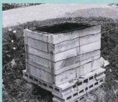
安く簡単にできます。でも、くれぐれも火の用心

中野区の何軒かの家で見かけるのが、この焼却炉。簡単に組めて費用も二〜三千円ほど。耐久性も十分とのこと。また、ブロックの穴が通風口になってよく燃えます。