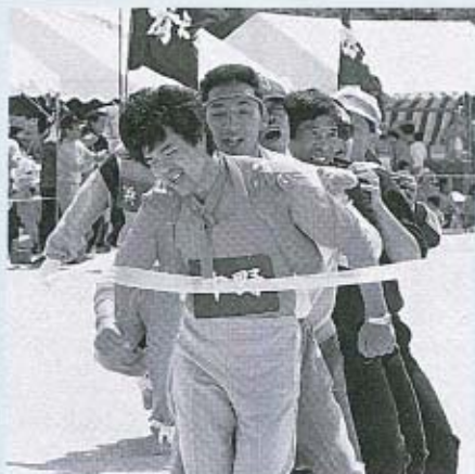
▲足並みそろえてゴールイン