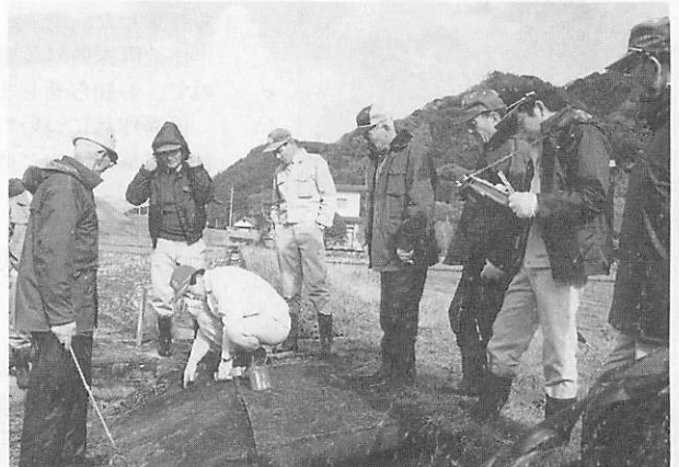
推進員が立会し、所有者間で境を決める一筆調査