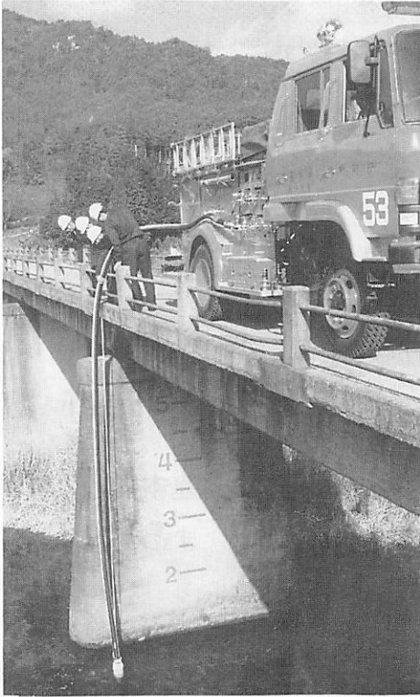
佐波高裏北野橋にて新車で訓練中