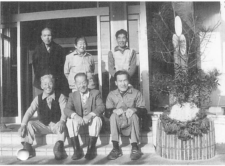
▲門松一丁あがり ハイポーズ