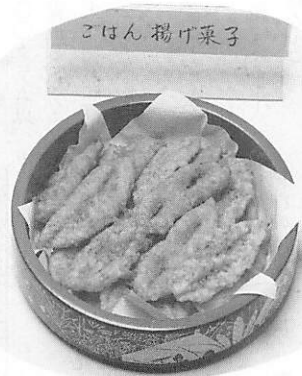
▶ モトは “徳地米” 姿変わって “揚げ菓子” とナリマシタ