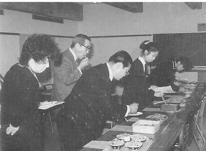
◀チヨイと失礼 どれがおいしいかな？