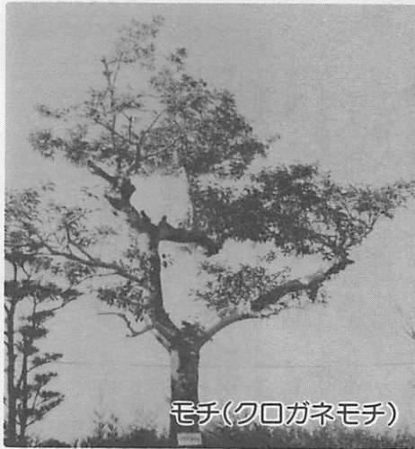
モチ(クロガネモチ)