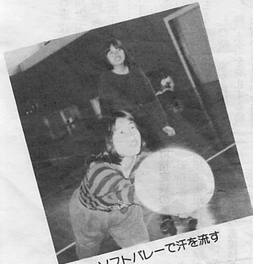
ソフトバレーで汗を流す

担当者は「夏にはキャンプを予定していますので、多くの高校生が参加してほしいですね」と呼びかけています。