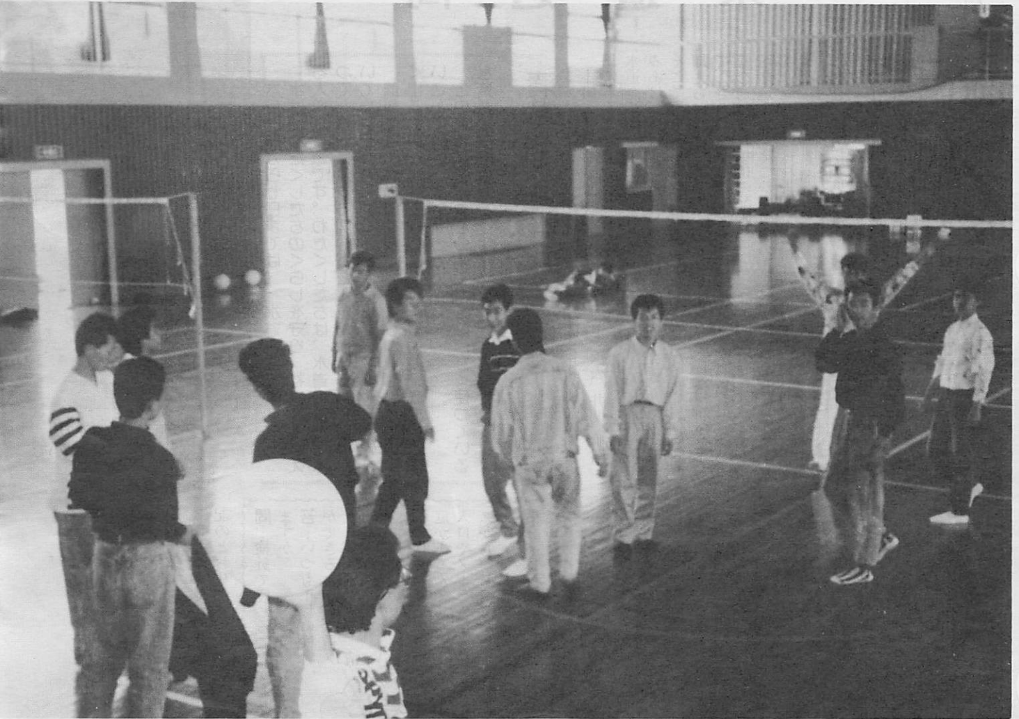
あちこちで話題に花が咲く