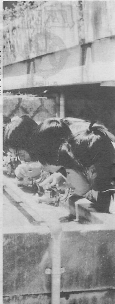
▲ジャグチをひねれば水が 阿知須小で

六月一日から七日までは、「水道週間」です。水は、わたくしたちのくらしを守り、社会をささえる大切な資源です。わたくしたちは、水道の普及によつて、「水」に対する関心がだんだんと薄らいではいけないでしょうか。