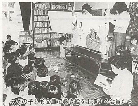
みやの子ども文庫の巻き絵を上演する会員たち

県立山口図書館が毎月1回、子供たちに絵本の読み聞かせをする「おはなしムーミン」。今月は、21日(火)の午後3時30分から4時まで、2階の青少年室で開かれます。今回の題材は『じごくのそうべえ』で、みやの子ども文庫の会員が巨大な巻き絵を使って上演します。この巻き絵は、幅約1メートル、長さ約30メートルにも及ぶ巨大なもので、会員たちの手づくり。昨年9月から2か月間かけて仕上げた大作です。この巻き絵、今までに3回上演しており、なかなか好評だったそうです。