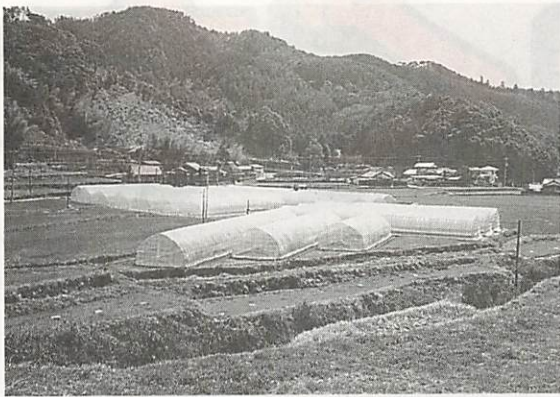
転作戦略作物ハウレンソウで産地づくり をめざすハウス団地(山口天花地区)