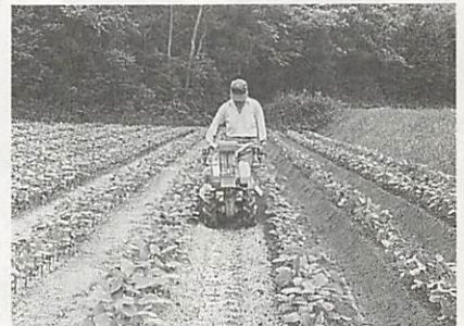
転作物「大豆」の中耕 培土(鑄鉄司道の上地区) 大豆の作付は、転作面積の25%を占めています。

事前売渡限度数量の配分も昨年並みとなっておりますので、米の計画生産により限度数量の枠一杯出荷されますようお願いいたします。