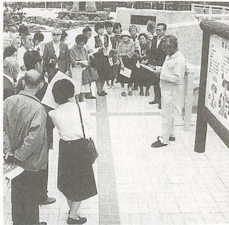
昨年の動くふるさと教室(9月30日)