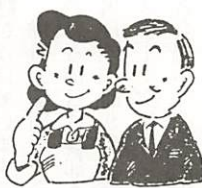
サラリーマンの奥さんの保険料はご主人の加入年金制度全体で負担されます。

第3号被保険者の届出をすると、ご主人の給料から保険料を天引されるから届出をしないという人や届出をしたが保険料が天引されていないので、国民年金に加入もれになっているのではないかと心配する人がいますが、そういうことではありません。