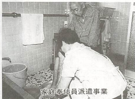
家庭奉仕員派遣事業

老人ホームの入所、家庭奉仕員(ホームヘルパー)の派遣、ねたきり老人等人浴サービス、シヤートステイ(在宅老人短期保護)、老人デイ・サービス等の相談を受け付けています。