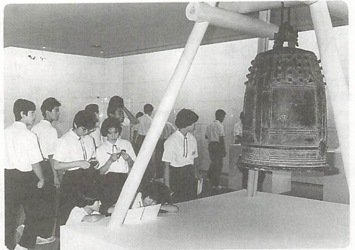
△郷土の歴史を大内文化にみる

9月8日と9日、維新公園や県政資料館を会場に、「いきいきシルバーフェスティバル」が開催されました。スポーツ交流会、文化祭や即売市などが開かれ、県内各地から参加した約15,000人が交流の輪を広げました。