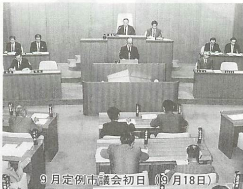
9月定例会市議会初日（9月18日）

興整備公団、県、市が一体となって実施した予備調査により、高速交通体系へのアクセスや山口県流通センター株式会社等の完備状況等により、工業機能と流通機能をあわせ持った団地としての開発整備を進める方向が打ち出されているものであります。 市としては、この方向に基づき、地域振興整備公団による産地地域振興事業の新規事業としての採択を前提に、埋蔵文化財の予察調査、団地凶化等の調査を実施するほか、団地計画を促進するため、去る8月、公団、県、山口・防府・小郡の2市1町、各商工会議所及び山口県流通センター株式会社等官民一体となった鑄銭司団地開発推進協議会を設置したところであります。 当用地の開発は、山