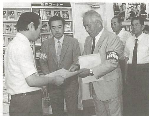
山口市青少年健全育成市民会議から市内のビデオ取扱店に対し自主規制を要請(9月1日)

ビデオ取扱店舗の増加とビデオ機器の普及に伴い、性的感情を著しく刺激するアダルトビデオや残虐性、粗暴性のあるホラービデオ等を、青少年が容易に手に入れることができる状況にあります。