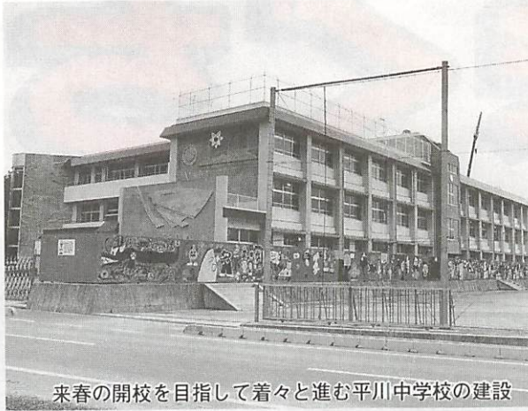
来春の開校を目指して着々と進む平川中学校の建設