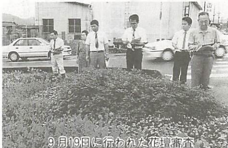
9月19日に行われた花壇審査