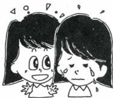
思いっきり泣けば、すぐに笑える

す。ちなみに、欧米人は、この排水管が太いので、泣くと涙が目から溢れるより先に鼻水として出てしまいます。ハンカチを目ではなく鼻にあてて泣くわけですね。