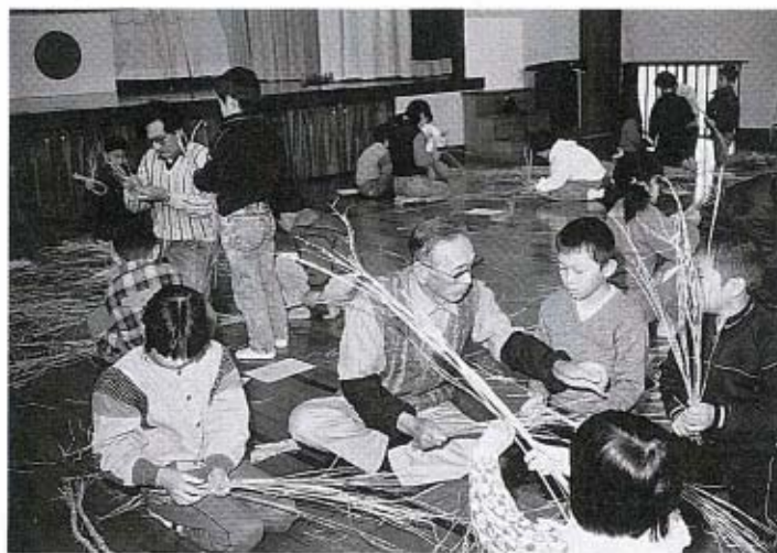
熱心に作りました

十二月二十四日(日)、中央公民館と大海分館で、秋穂町伝承グループの皆さんのご指導による、しめ飾りづくりの講習会を