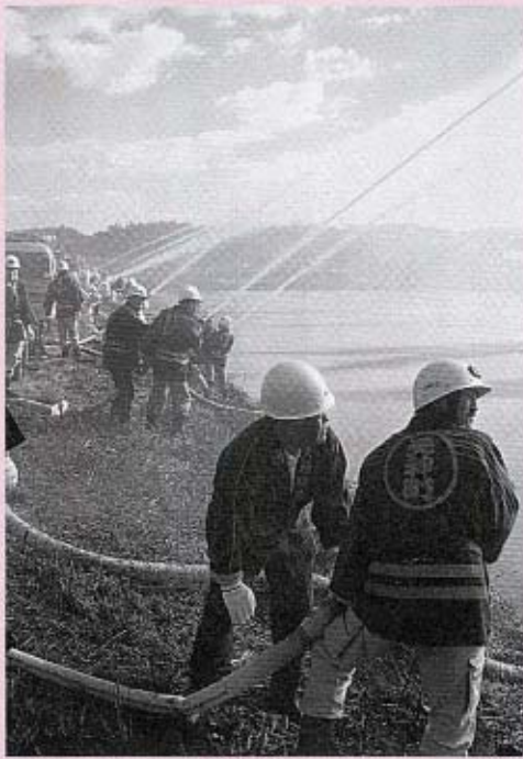
夫婦池での一斉放水