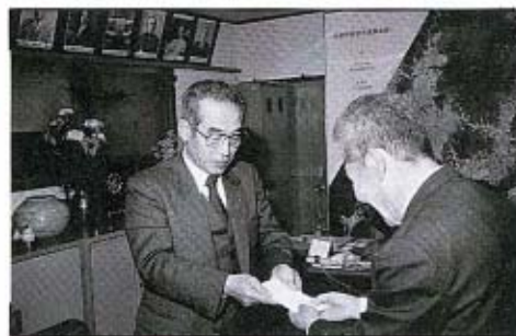
1月5日、町長室で、木原会長より

紙は、一月七日、山口南ロータリークラブの皆さんが、秋楽園を慰問に訪れた時の様子です。 この日は、映画の放映や、山口市役所のかたや子どもたちによる獅子舞が行われ、楽しい催しに、お年寄りたちはたいへん喜んでいました。 また、この前々日の一月五日、同クラブが年末に行った慈善鍋で集まったお金が、赤い羽根共同募金に寄附されました。