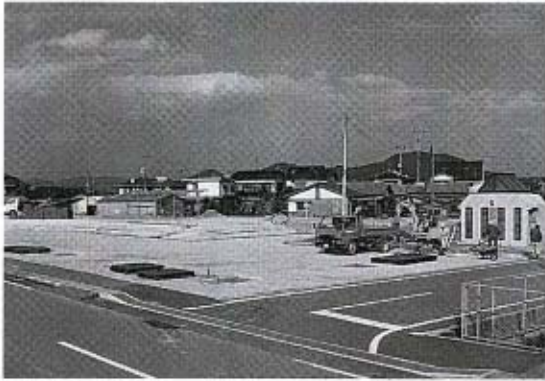
整備の進む祇園町地区の公園