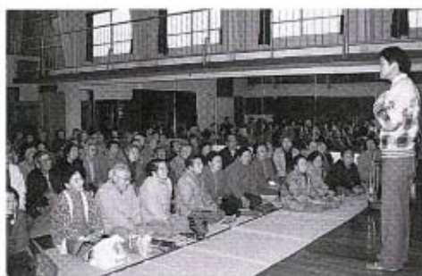
有意義なお話でした

開催しました。この講習会には、両会場に約八十人の参加があり、伝統のしめ飾りづくりを継承しようと、熱心に縄ないをしました。毎年続けて参加している子どももあり、鮮やかな手つきで、立派なしめ飾りを作っていました。そして、お昼ごろには全員出来上り、作ったしめ飾りを手にも、喜んで家路につきました。みんな、手作りのしめ飾りを通して、楽しいお正月を迎えることができたことでしょう。