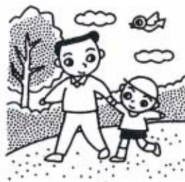
みんなの憩いの場に

公園の整備は、昭和五十四年度に漁港浚渫土によって埋め立てられた用地に、昭和六十三年度から行われてきました。 公園の周囲には、桜やどんぐりの木を植栽し、公園内にもフラワーポットを設置して、緑に触れて心をなごませることができます。 また、秋穂湾を見渡せる所にベンチなどを設置して、自然の中で語らい憩える場を提供します。