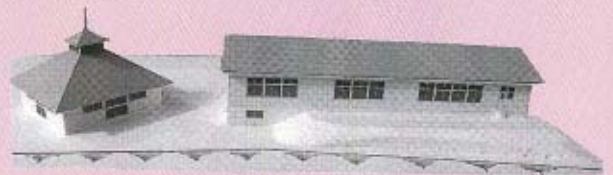
コミュニティセンターの完成予想模型