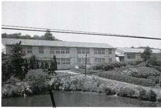
生まれ変わる秋穂分校