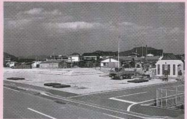
整備がすすむ祇園町地区の公園