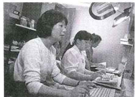
4人で楽しくがんばっています

さて、この若妻さんは、町内でミニトマトを作っている四人組。農業離れが進むなか、夢を育てる農業と子育てに奮闘しな