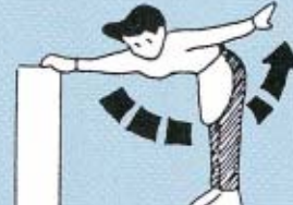
片手でからだを支え、もう一方の手を振り上げる。(10回)