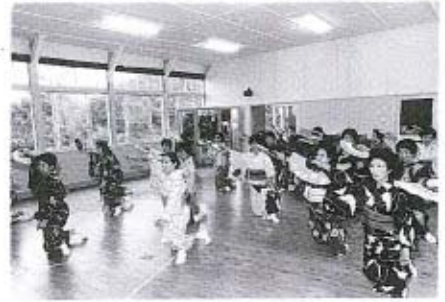
黒田節・踊りの練習会（6月23日）