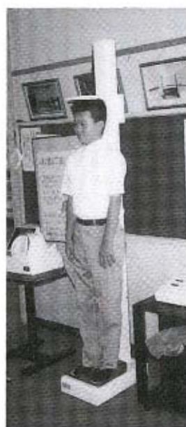
全自動身長体重計