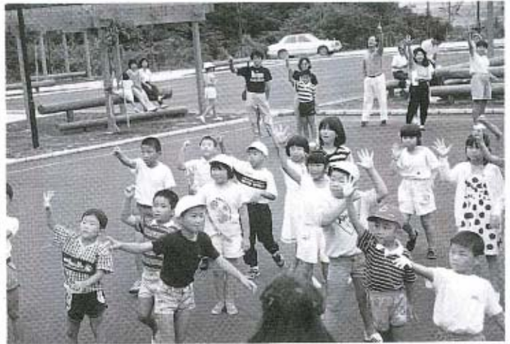
秋穂小の3年生がレクリエーション（7月1日）

秋穂コミュニティセンター（愛称・にににこ館）が開館して三カ月余り。六月末までに述べ二千八十五人のかたが来館しています。広報「あいお」では、よりいっそう多くのかたがたに来館いただくため、今月から「にににこ通信」と題したコーナーを設け、コミュニティセンターの行事のお知らせや催しの様子を掲載していきます。このコーナーを、皆さんの笑顔でいっぱいにしてください。