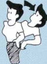
腰をうしろにそらす。