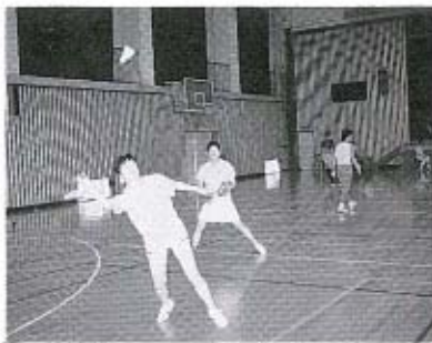
気持ちいい汗かきました