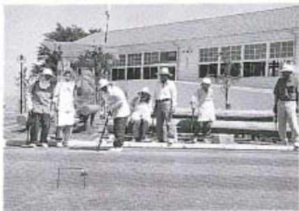
ゲートボールの親睦試合（6月23日）