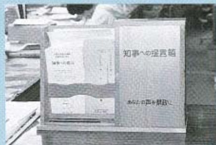
「知事への提言箱」 保健衛生課窓口にあります

ケート調査が行われます。あ なたのお手許にアンケート用 紙が届きましたら、ご協力を お願いします。なお、このテ ーマによる提言は、調査対象 者以外のかたからも募集して います。あなたの建設的な提 言をお寄せください。 テーマ 介護等が必要な高齢 者が地域で安心して暮らせる ために 募集期間 8月1日〜31日 お問い合わせ 山口県企画部 中央県民相談室 ☎08339 23111