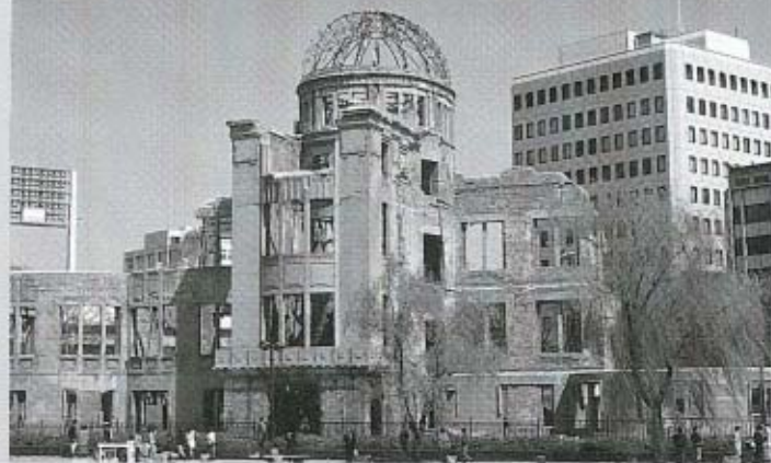
“原爆ドーム”