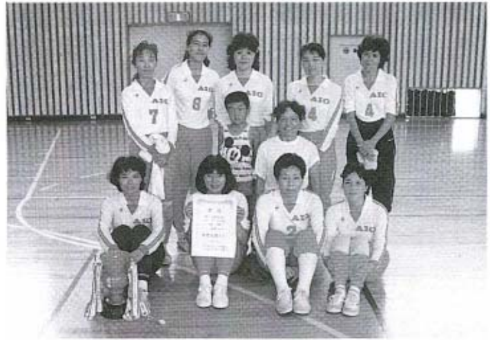
婦人の部で優勝した秋穂クラブの皆さん