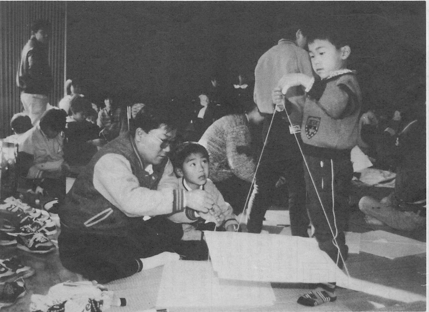
▲糸の位置を確かめて