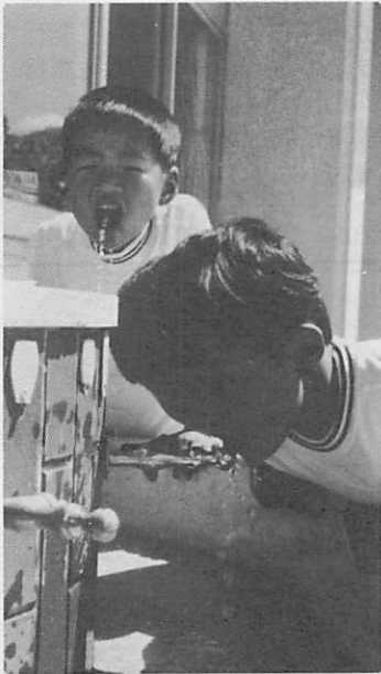
▲水はおいしいなあ…井関小学校