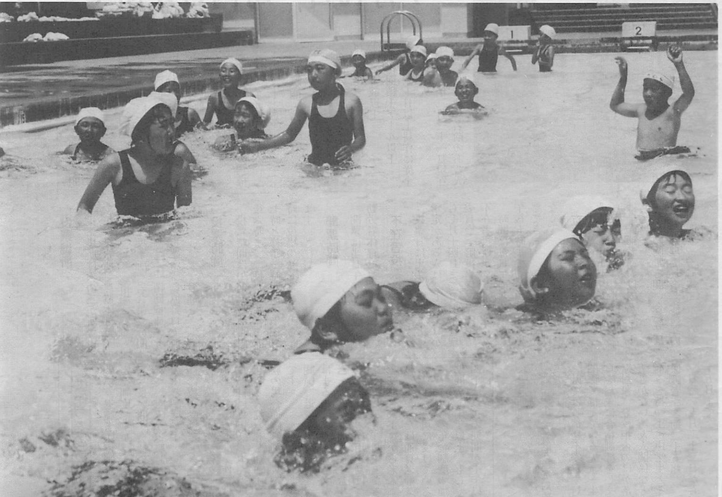
▲プールはやっぱり楽しいなあ～