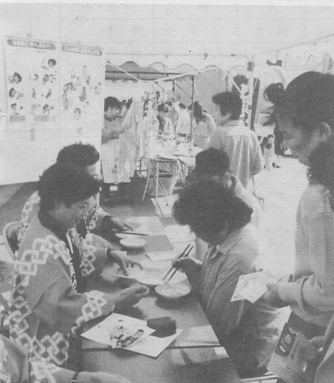
▲よくつかめますか(健康フェア)