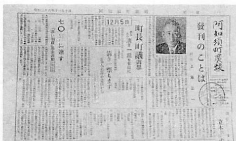
▲昭和26年11月の創刊号

版の大きさは町の広報紙と同じで、千二百十二ページ。購入申し込みは一般家庭の場合、区長を通じての申込書をもって。また、事業所は町