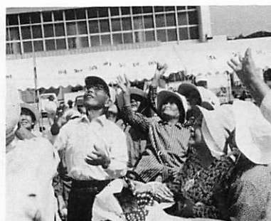
◀ 玉入れに熱中 (高齢者大運動会)