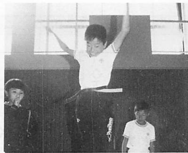
◀垂直とびに挑戦 (健康体力づくりの集い)