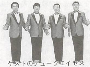
ゲストのデュークエイセス