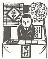
葬式の花輪や香典