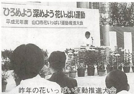
今年の花いっぱい運動推進大会

社会教育課といいますが、何かとても難しく、特別な事をしている課であると思われる方もいらっしゃるのではないでしょうか。しかし、何も特に難しい事をしていない訳ではありません。たとえば、子ども会やPTA、婦人会などの地域活動。公民館の活動。市の美術展や文化祭など芸術文化活動を行って活動を行っています。こうした活動を通して、心豊かな人づくり、ふれあいのある地域づくり、うるおいのある生きがいづくりを目指し皆さんの社会生活を側面的に援助しています。 また、最近では、「生涯学習」ということがよく使われていますが、これを中心となつて進めているのが社会教育課です。 社会教育課には、予算や経理、文化行事の援手申請の受け付けや公民館などの施設に関する事務を扱う庶務係。地区公民館の運営指