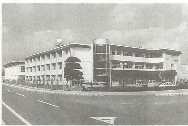
新設された平川中学校(4月開校)

教育委員会事務局の組織、人事、事務事業の総合調整など他の課に属さない市教育行政事務のいろいろな業務を処理し、教育環境の整備を行っているのが総務課です。 市役所庁舎3階に位置し、課には、管理係と施設係があります。課長以下11名のスタッフが意欲的に業務に取り組んでいます。 管理係の主な業務は、委員会の規則、規程の制定及び改廃。委員会会議に関すること。また、各小・中学校幼稚園の管理運営に必要な予算の調整。教材、教材備品の整備など学校、幼稚園の教育活動に支障をきたさないよう努力しています。 また、学用品費などの就学援助費の支給や相談も受けています。その他幼稚園就