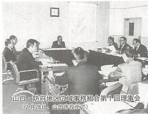
山口・防府地区広域事務組合第1回理事会 (2月28日、山口市役所で)

歳出予算で増額となるものは、退職手当(1億5千6百万円)、開発振興基金への積立て(2千3百10余万円)、山口・防府地区広域事務組合