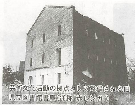
芸術文化活動の拠点として整備される旧県立図書館書庫(通称「赤レンガ」)

陶小学校から西へ約300m行くと右手の小高い所に寄船社があり、鱸網の森といわれている。鱸網の森は昔国道沿いにあったが、バイパスの建設により現在地に移された。鱸網とは、船をつなぐという意味で船つき場、港という意味。今から1000年以上前に百済の琳聖太子が舟をつけて上陸したといわれる。