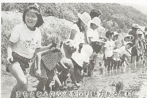
まちとむちの交流を図り魅力ある農村に

山口市の農業は、耕地面積が5千4百畝で、このうちの約5千畝を水田が占めるといふ典型的な土地利用型の農業となっています。また、米の収穫量は、1万8千6百トと県内で最も多く、県全体の11%を占めています。