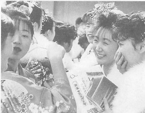
若者にとって魅力的で躍動感あふれる中核都市やまぐちの実現に向けて(山口市成人式)

とです。老人にはデイ・サービスがありますが、子どものデイ・サービスといったものも必要かも…2、3日、預かって