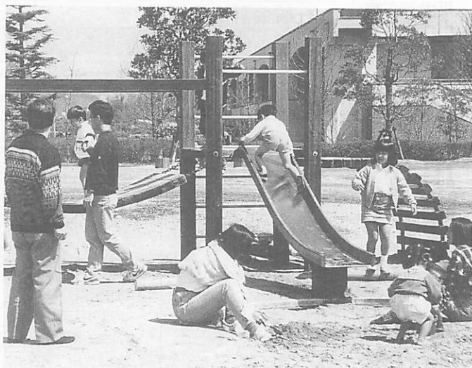
一人ひとりが時間と心にゆとりのある豊かな生活の創造を