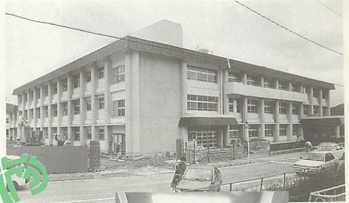
平成2年度で全ての改築が完了した平川小学校(写真上)。体育館と普通教室棟との間を利用したスカイホールは、天窓もあり明るい(写真左)。