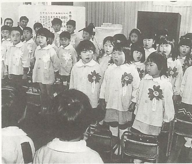
園舎が建て替わっていくのを目の前にしてしながら入ることができなかった年長組のため、小鯖幼稚園の卒園式は、引越し前の真新しい園舎で行われました。