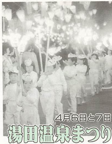
4月6日と7日 湯田温泉まつり