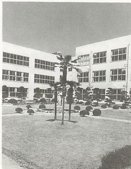
内側も外側も新しくなった白石中学校の校舎。あと1年で、改修工事も全て終わります。

中学校の校舎は、戦後の建物が多く、ほとんどが鉄筋コンクリート。建物自体は、耐用年もまだ来ておらず使えるため、外壁や内部の痛んだところを全面的に改修することに対応しています。