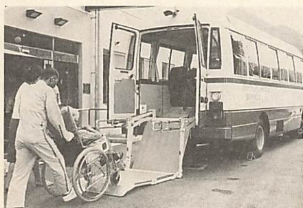
身体の不自由な方のデイサービスに送迎するリフトバス

整備を行いました。体育施設の整備では、市民プールに自動循環装置を設置したほか、宮野河原地区に予定している市民スポーツの森の測量を行いました。また、全日本実業団ハーフマラソン大会をはじめ、各種スポーツ大会を誘致しました。 など福祉施設の整備充実を図りました。 児童福祉については、留守家庭児童学級の運営、陶地区、平川地区に、ちびっこ広場の設置補助を行いました。 このほか、福祉優待乗車証、福祉タクシー利用券の交付をはじめ、各種福祉団体、施設への補助等を引き続き実施しました。