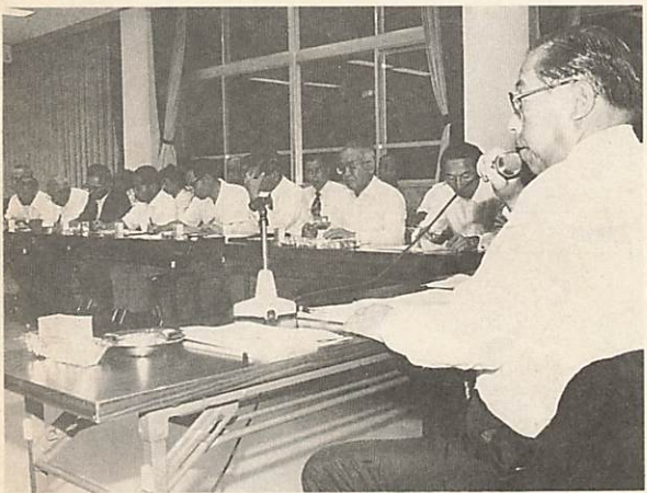
「市長を囲む会」がスタートした。和やかなムードの中で進められた。なお、7月29日に開かれた鑄銭司地区の市長を囲む会の模様を、TYSテレビ山口で8月18日(日)の午前11時40分から50分間、「私たちのまちなみやまぐち」の番組で放映します。

この会は、次回が8月28日に秋穂二島地区で開かれ、残りの地区についても、日程調整をしながら12月末までに、全地区での開催が予定されています。