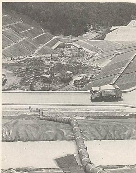
大内神田の廃棄物処分場は総事業費12億円、34万㎡の容量で10年間処理できる

都市計画事業では、仁保上郷地区の2百74畝の地籍調査を行い、土地区画整理事業を進める大歳矢原町の基本計画の地元説明を行い合意形成に