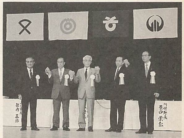
盟約を締結し、友好を深める市・町長

また、今年のサミットには、昨年のサミットで、交流事業を広げていこうということと、加盟参加市・町の子供による「子どもフォーラム」も開催され、市内からも29人の子供が参加し、鮎のつかみ取り、キャンプファイヤーや地曳網を引いてよその市・町の子供たちと交流を深めました。