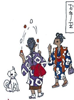
徳見七郎水彩画 山口市歴史民俗資料館所蔵