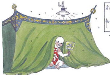
徳見七郎水彩画 山口市歴史民俗資料館所蔵