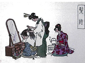
徳見七郎水彩画 山口市歴史民俗資料館所蔵