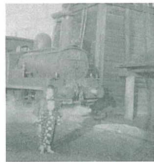
小郡駅のホームで