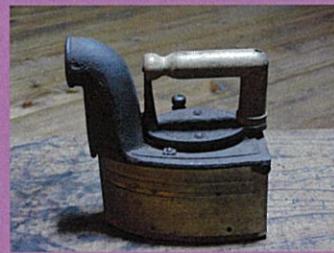
アイロン作業の再現（撮影可）