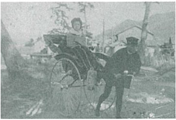
人力車に乗る女性