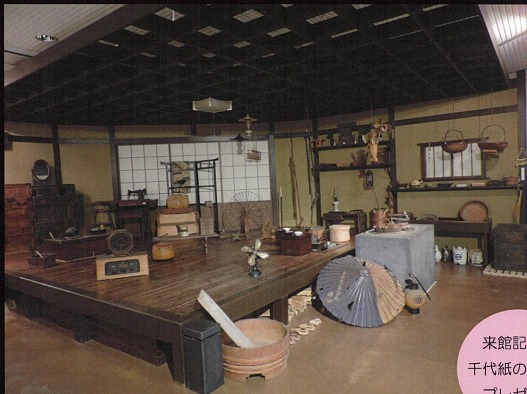
「むかしの暮らし」展示室

今から百年前は大正時代です。当館所蔵資料と複製資料で当時の様々な場面を再現し、写真撮影や体験をすることが出来ます。一日のうちの数時間、当館で大正時代にタイムスリップしてみませんか？ 新型コロナウイルス対策をしっかりと行っ た上で来館をお待ちしています。