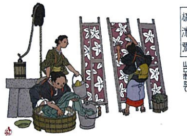
徳見七郎水彩画 山口市歴史民俗資料館所蔵