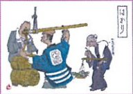
徳見七郎水彩画 山口市歴史民俗資料館所蔵