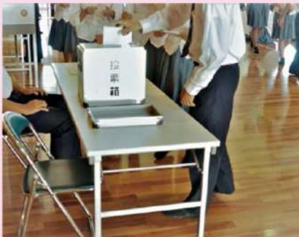
生徒会役員選挙の様子

市内中・高等学校の生徒会役員選挙に学校教育の支援の一環として、実際の選挙で使われる投票箱等の備品の貸出を行っています。