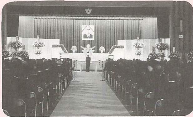
しめやかに葬儀が進む会場