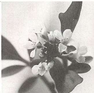
オランダガラシの花