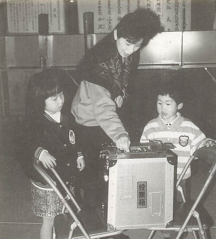
昨年の衆院選で＝八坂投票所