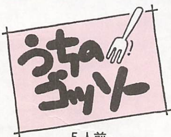
5人前 中華風ちまき ③⑥