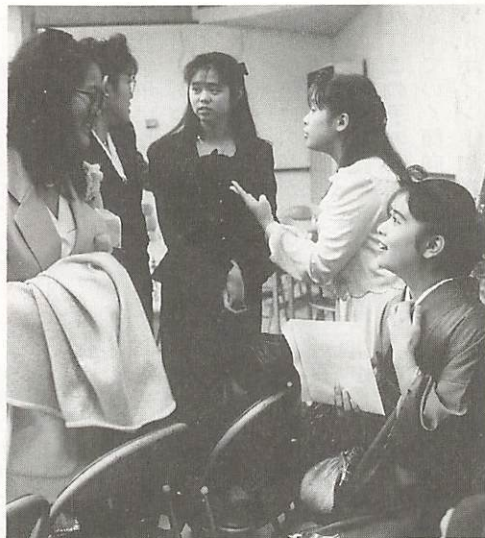
今年の成人式より