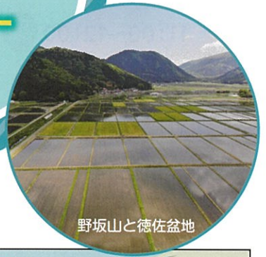
野坂山と徳佐盆地