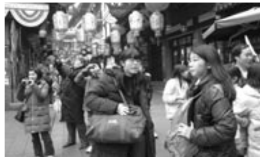
2月5日 上海市の豫園を見学