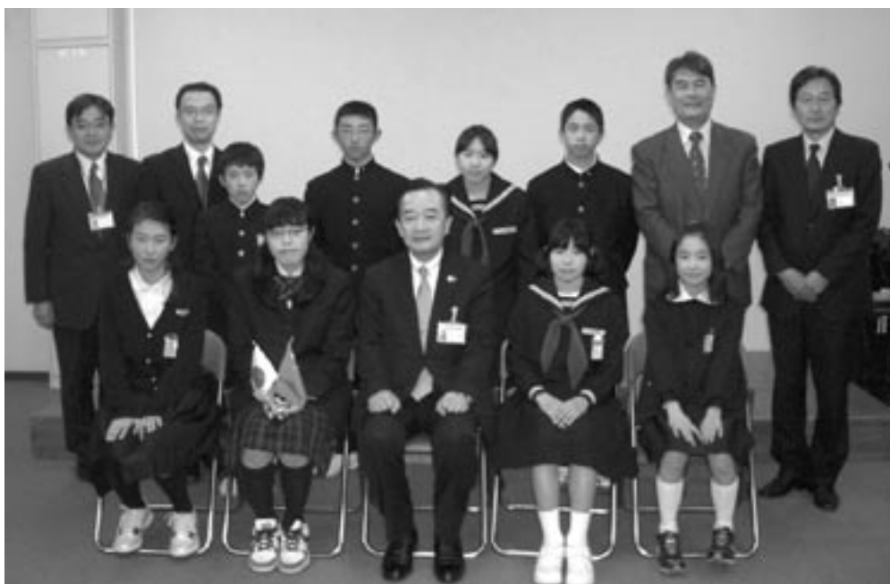
1月18日水曜日の訪問団出発の様子（山口総合支所 第11会議室）