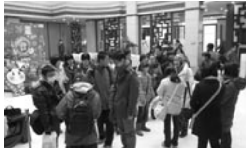
2月4日 ホームビジットに出発