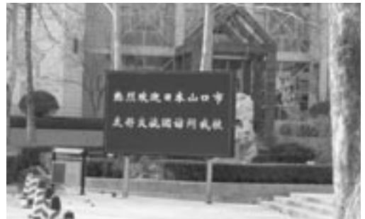
2月3日 済南外国語学校訪問