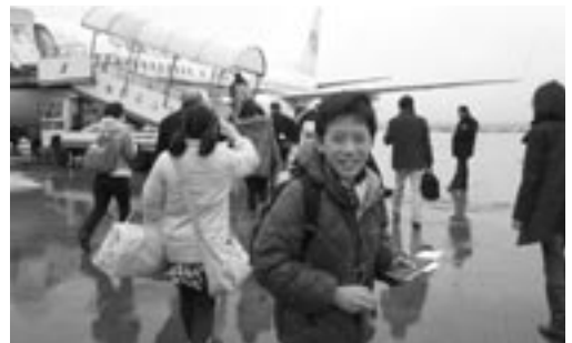
2月6日 中国東方航空の航空機へ搭乗