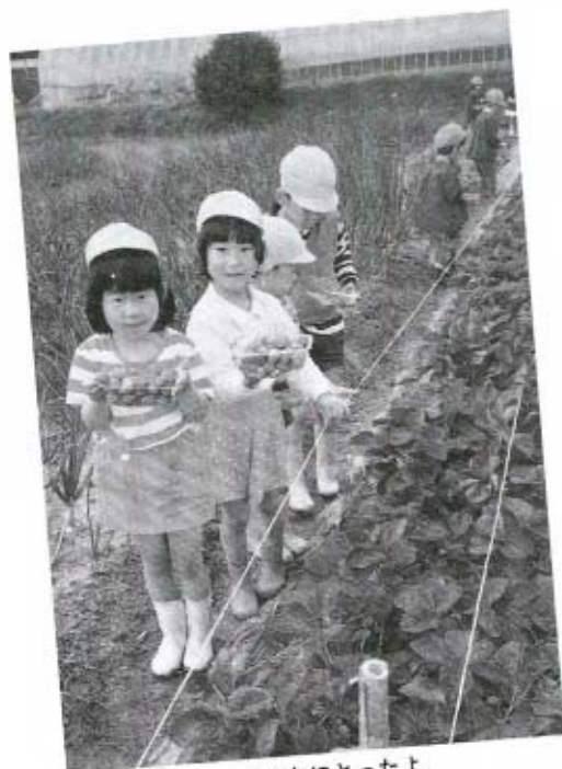
こんなにとつたよ