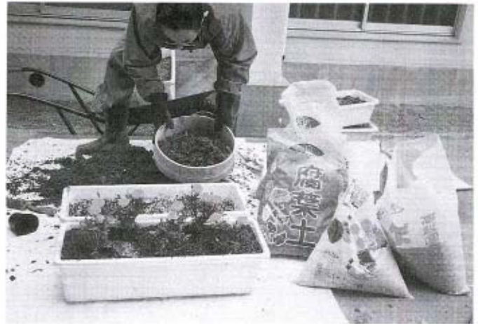
広げよう花いっぱいの輪

公民館では、ふれあい教育の一環として、子どもからお年寄りまでが取り組め、情操を養う花いっぱい運動を展開していく