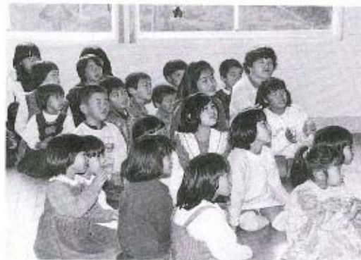
ゲームを楽しみました

七草がゆは新春の一月七日に食べると病気になるまいといわれています。そのうえ、この日の七草は、生活改善実行グループの皆さんが苦労して集めた愛情込められたもの。平均二、三杯も七草がゆを食べた皆さんは、一年の無病息災が約束されたようなものですね。