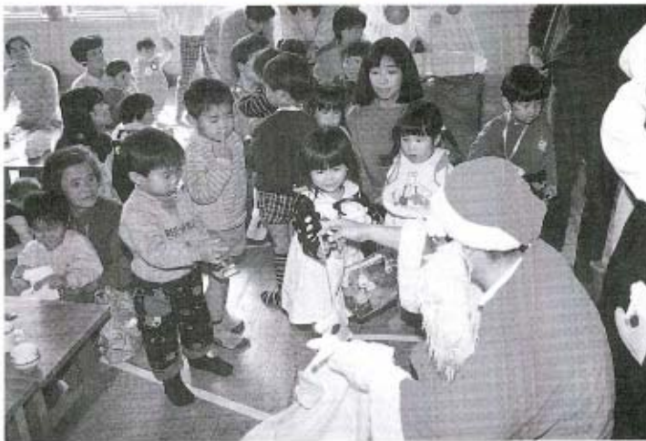
12月18日(水)のクリスマス会で