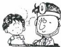
やむをえない事情で、当番医を変更することがあります。 吉南医師会