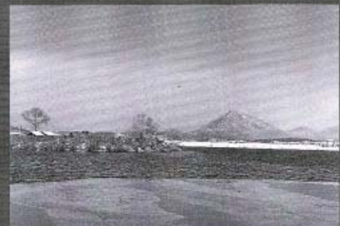
「夫婦池から陶ヶ岳を望む」(雪景色)