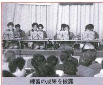
練習の成果を披露