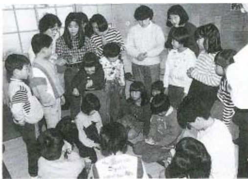
決勝戦で、「何枚あるかな？」