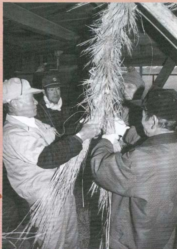
はしごを使って4~5人がかりでしめていきます。