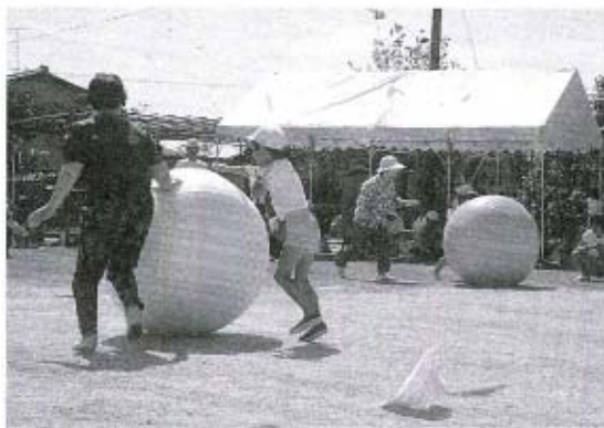
地域の人たちと交流 (黒湯母親クラブ)