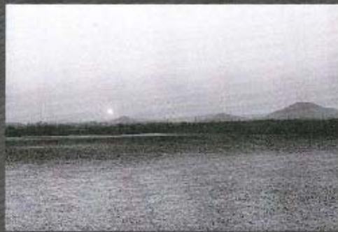
“夫婦池から黒湯を望む”