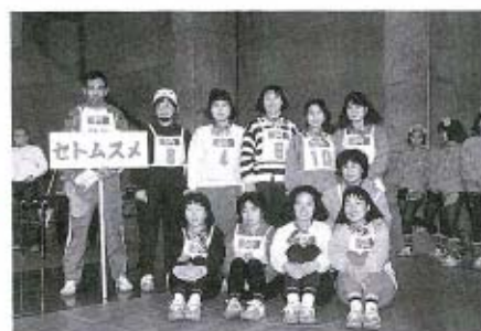
秋穂農協「セトムスメ」の皆さん