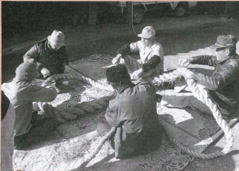
ケバをていねいにとっていきます。