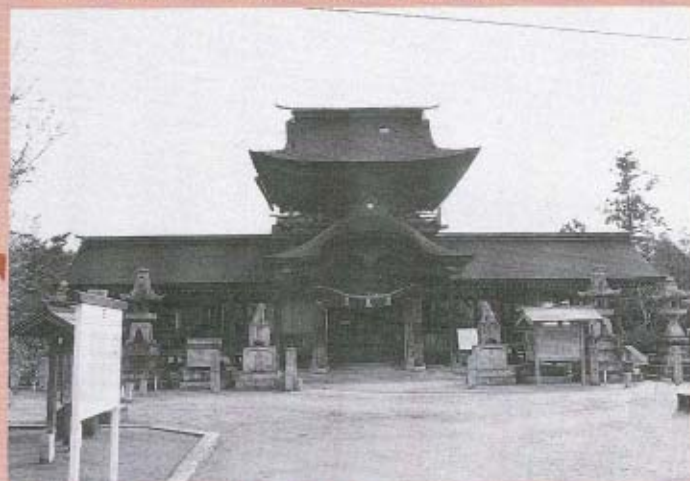
楼門にも立派なしめ縄がかけられました。