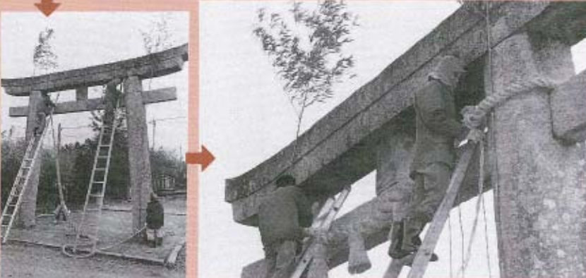
鳥居にしめ縄をとりつけます。これがまたたいへんです。(写真は二の鳥居)。