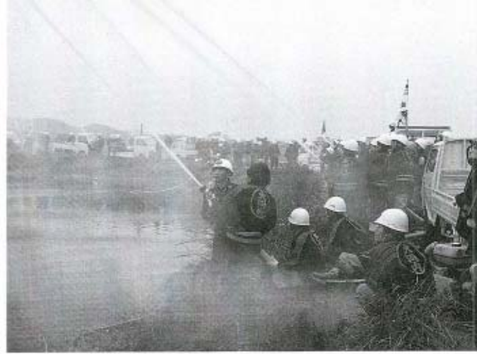
夫婦池での一斉放水