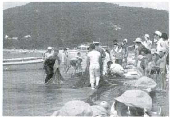
いっぱいにとれたかな (秋穂母親クラブ)

台風十七号の置き土産で黄金のジュータンも精彩を欠きましたが、真紅の曼珠沙華の咲き乱れる九月二十二日は、絶好の運動会日和となりました。 この日は、子どもたちにとって地域の人たちとふれあいを深めるよい機会です。 親や祖父母、そして秋楽園の