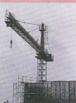
水平タワークレーン(トンボクレーン)