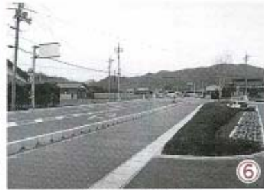
⑥ 大海小学校横からの新設県道。