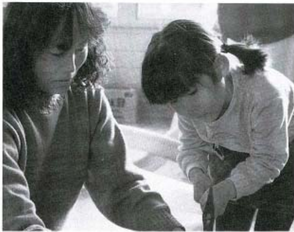
1月19日(日)、親子えんぴつ立てを、19人が作りました。