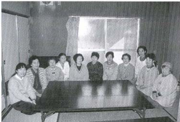
2月1日出、「節分行事」で集まった皆さん