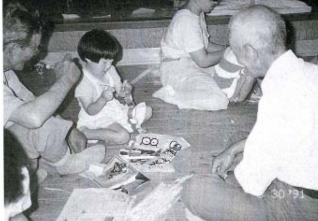
おじいちゃんのやさしい目