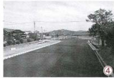
④ 県道19号線との交差点。周防大橋からは2.4km。ここから中条までが大海秋穂二島線。