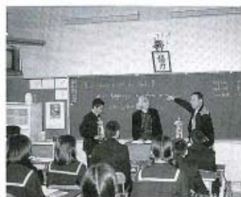
英語指導助手を招へい（教育費）