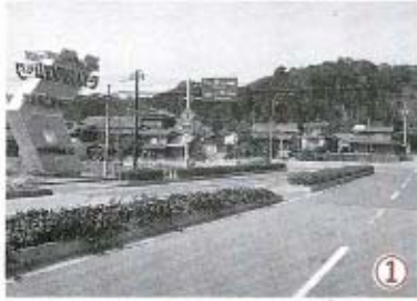
① 国道2号線から山口テクノパークへの入り口。ここから国道190号線へ至るまでの山中阿知須線は、全長6.1km。