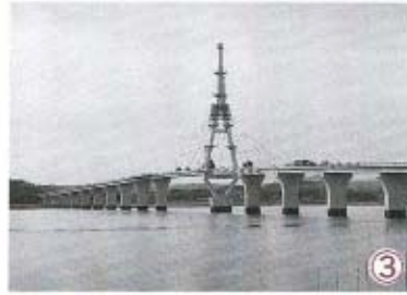
③ 県内2番目の長さ(1,040m)を誇る周防大橋。白さが羽根を広げたような美しいその姿は、この道のシンボルにふさわしい。