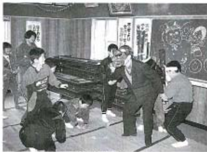
2月1日(土)、中津江公民館で