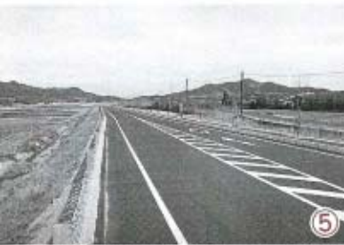
⑤ 天田地区の田園地帯をまっすぐに伸びる県道。惣在所から中条までの距離は4.35km。