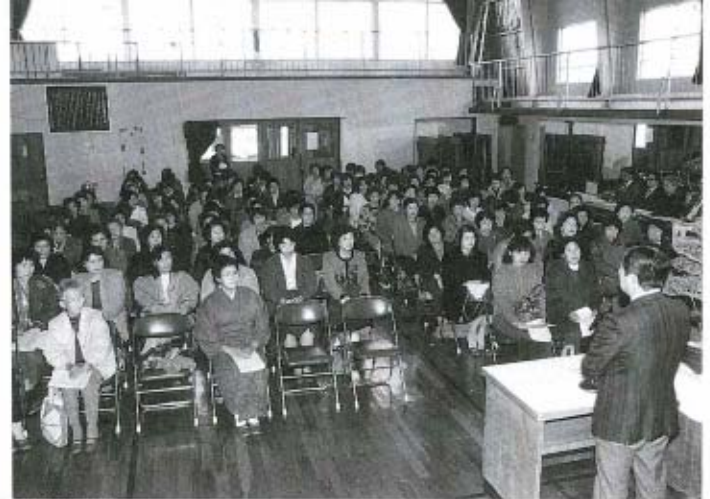
環境問題をみんなで真剣に考えました