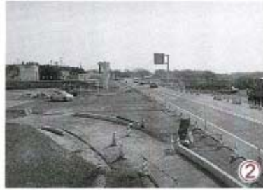
② 国道190号線との交差点。ここからが防府佐山線のスタート。周防大橋までは2.72km