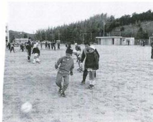
基礎をみっちり学びました