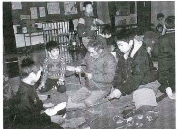
竹はこうやって割るんだよ