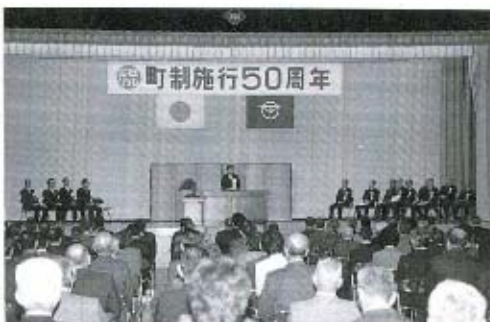
町制施行50周年記念事業を展開（総務費）