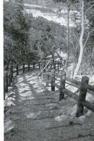
串山連峰遊歩道を整備（商工費）