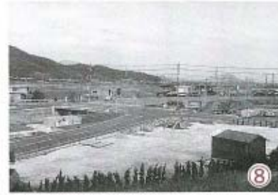
⑧ 現時点での大道からの入り口はここ。国道2号線との接続が終われば、中条からの距離は5.2kmとなる。