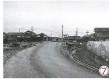
⑦ 大河内から県道へのアクセス道。