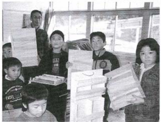
2月11日(火・建国記念の日)、状差し作りに13人が挑戦しました。