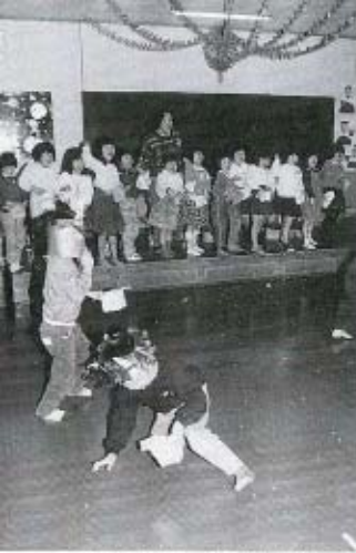
2月3日(月)、黒湯保育所で