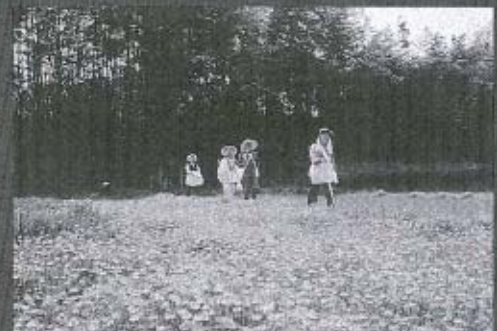
「お遍路さん」