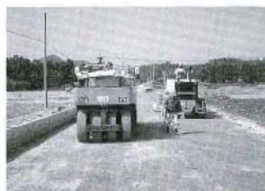
町道青江宮ノ目線を改良（土木費）