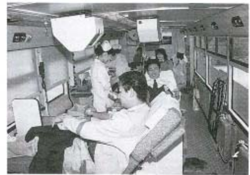
1月20日(月)に行われた献血で