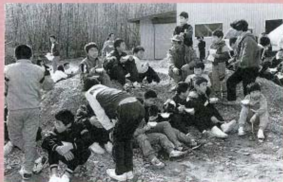
完走後、食生活改善推進協議会の役員さんの心づくしのぜんざいに舌つづみをうち、レースの疲れも吹き飛びました。