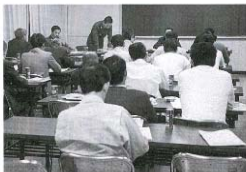
青少年の動向を聞く