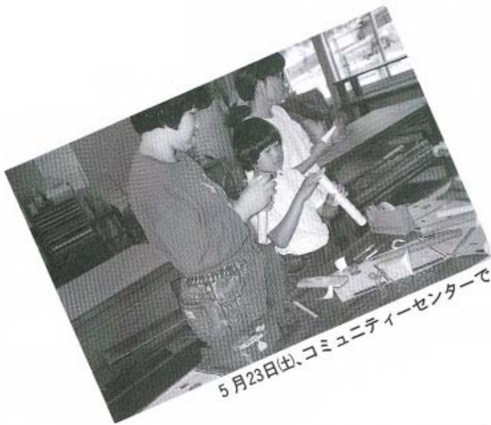
5月23日(土)、コミュニティーセンターで