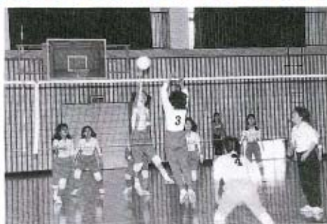
アタックにも力が入ります