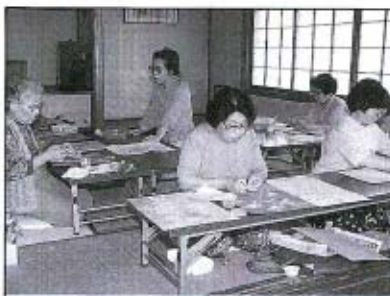
一つひとつに心をこめて