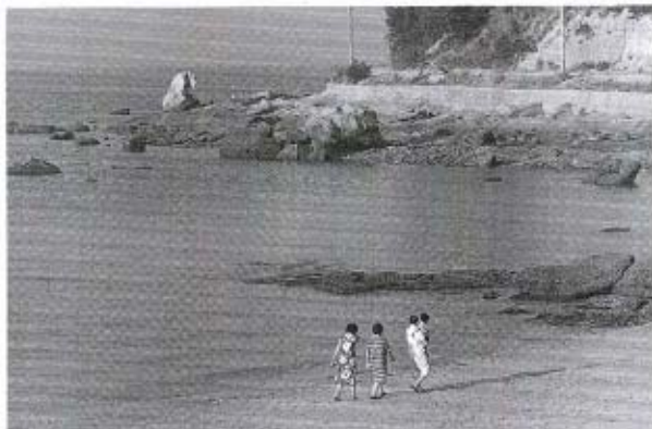
尻川から花香山を望む