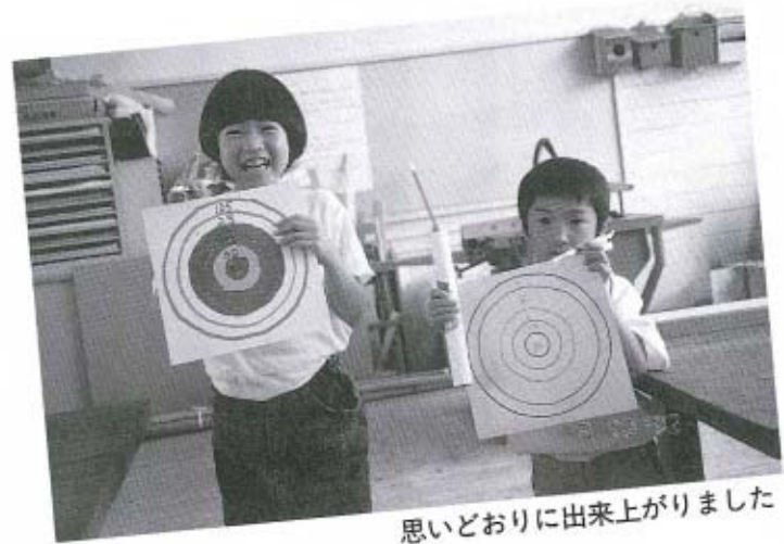
思いどおりに出来上がりました