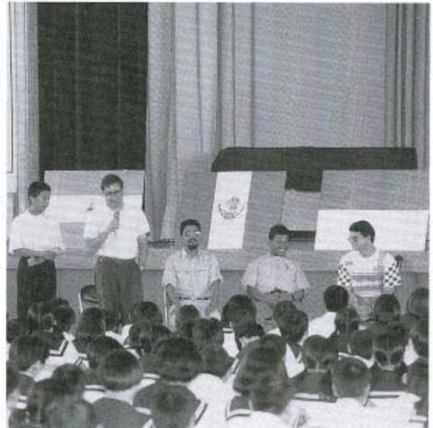
講師一人ひとりから自己紹介