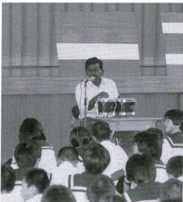
スリランカのリドリーさんによる民族音楽の演奏です