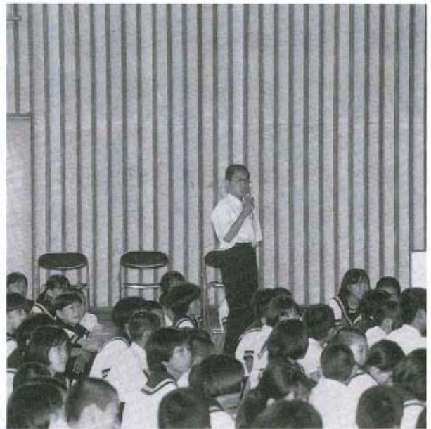
質問も積極的に飛び出しました