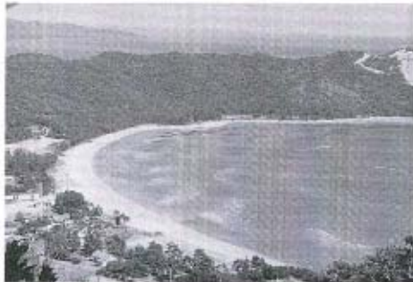
「串山から中道湾を望む」