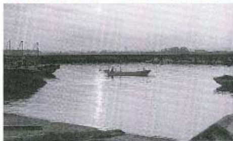
「秋穂漁港」