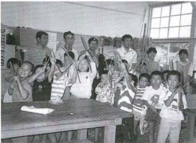
みんな、上手に出来ました。