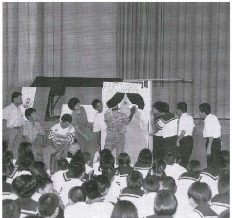
福笑いにも挑戦しました