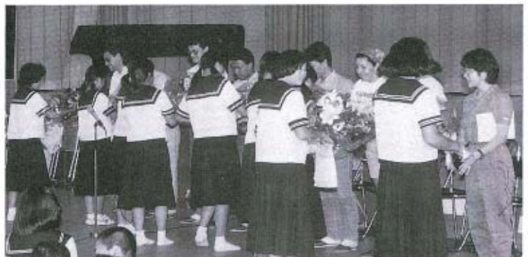
最後に、感謝の気持ちを込めて花束贈呈