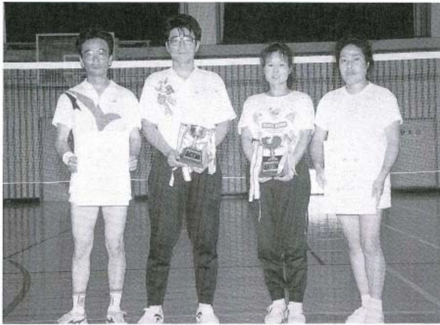
見事、優勝の両ペア