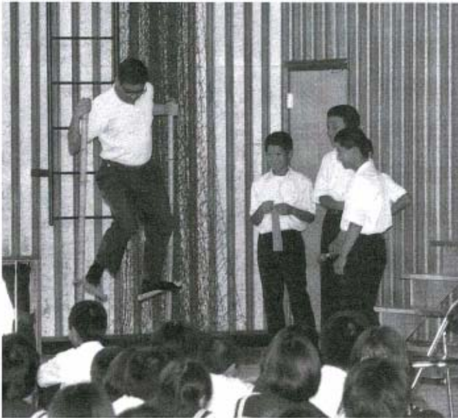
講師の先生も日本の伝統的な遊び、竹馬に挑戦です