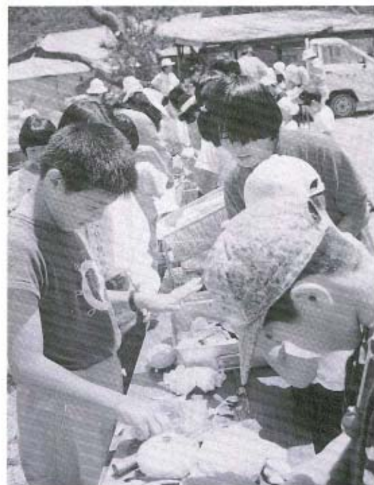
上手に切れるかな

早速、ジュニアリーダーの指示に従って班をつくり、役割分担をして、パーベキュー作りを