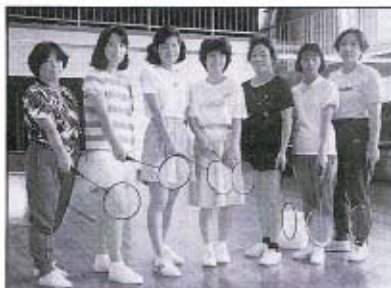
会員募集中! お気軽にどうぞ