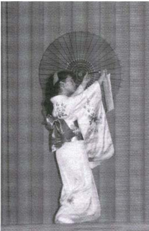
見事な日本舞踊を披露しました