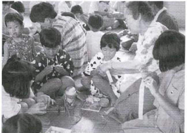
短冊に願いを込めて、七夕飾りを作りました。