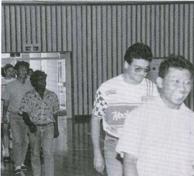
講師のみなさんの入場です

この集いは、生徒会執行部と学習委員会の主催で行われたもので、全校生徒の皆さんも、講師のかたがたによる各国の特徴、国家的なイベントや人々の生活習慣（様式）などの話、また、民族音楽の演奏を聴いたりして、風俗、文化などの日本との違いを認識していただくようです。 また、講師への質問のコーナーでは、「講師のかたの国のポピュラーなスポーツは？」「日本のなもので好きなものは？」といった質問が積極的にされていました。 さらに、日本を紹介するコーナーでは、福笑いや竹馬といった伝統的な遊びや日本舞踊の披露が行われ、講師のかたも日本の文化に触れることができました。 集いの様子を写真で紹介しましょう。