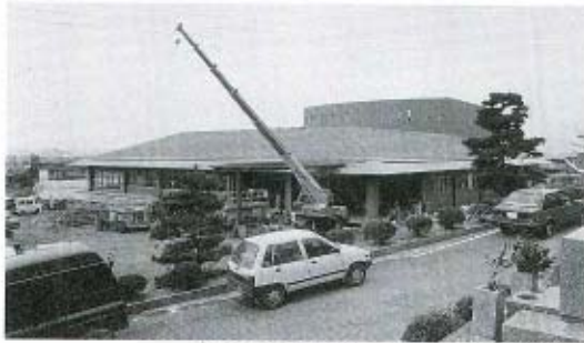
町役場新庁舎の建設 (総務費)