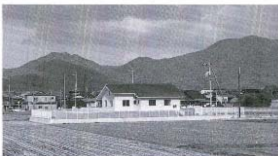
農業集落排水終末処理 (農林水産業費)