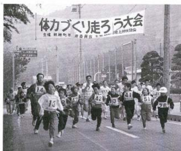
元気いっぱい「ヨーイ、ドン！」