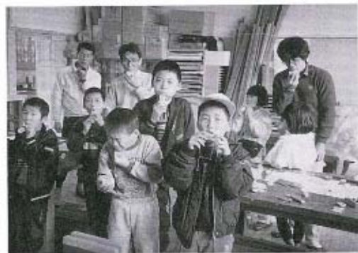
フィルムケースを使って笛を作りました