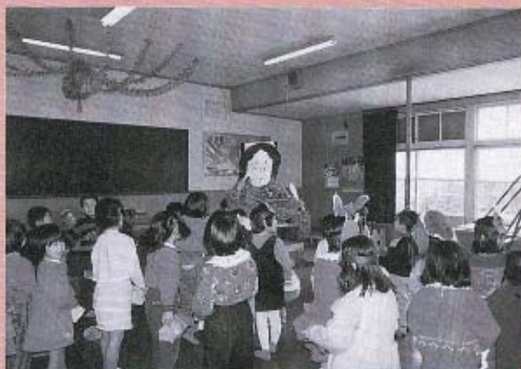
鬼が退散して、部屋には福の神が!