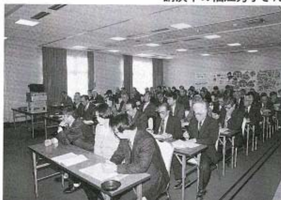
聴講する約80人の参加した皆さん