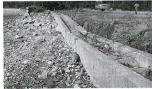
台風19号による災害の復旧工事(災害復旧費)