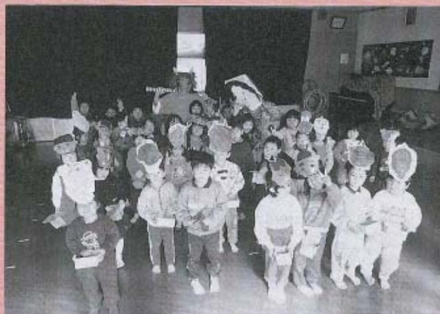
福の神・改心した鬼と一緒に!