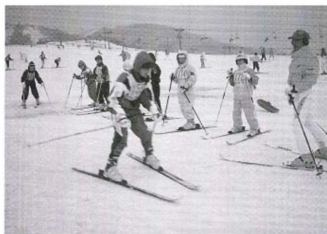
指導者の教えで基本をしっかりと学びました