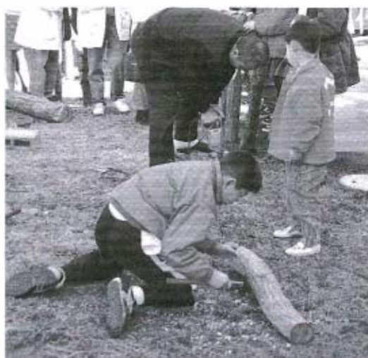
今から成長が楽しみです