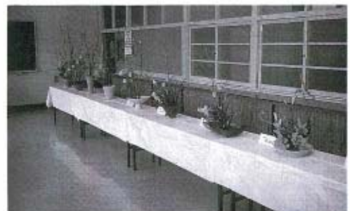
生け花の展示コーナー(華道教室)