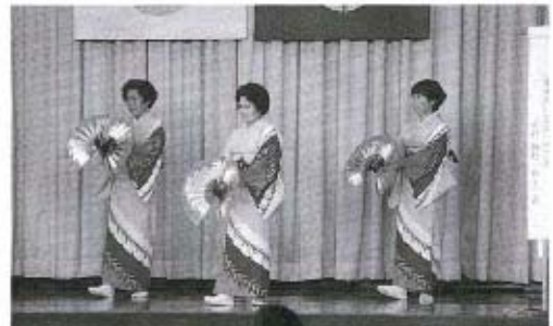
華麗な踊りが披露されました(民踊教室)