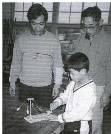
手動のメリーゴーランドを作りました