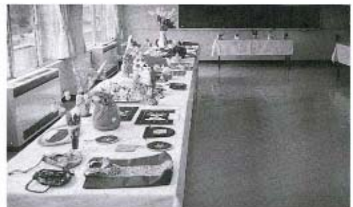
パッチワークなどの展示コーナー(洋裁教室)