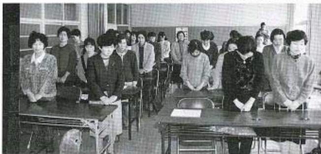
晴れて食生活改善推進員となった皆さん

2月17日(木)、中央公民館で、栄養教室の閉講式が行われました。 この教室は、山口環境保健所の主催で、昨年の5月から10回にわたって開催されてきたもので、住民の健康の保持、増進に寄与する食生活改善推進員を養