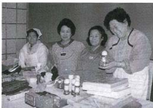
母子寡婦福祉会の皆さんによる不用品バザーコーナー(ふれあい祭りから)