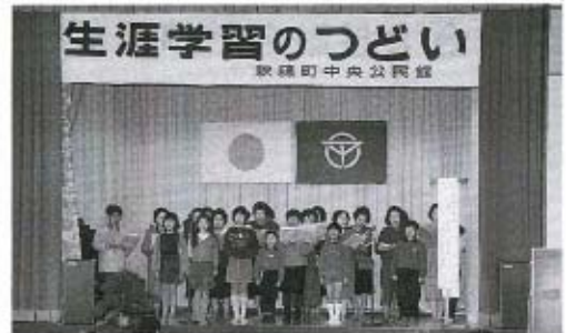
うまく歌えました(おんち教室)

また、この日は「ふれあい祭り」も開催され、中央公民館は終日にぎわいを見せていました。