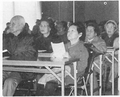
▲高齢者教室閉校式