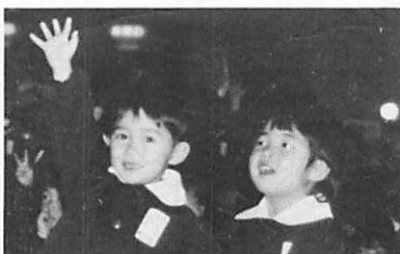
▲明るい子どもたちへ…