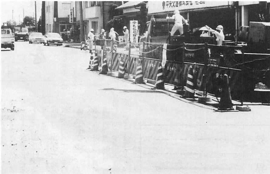
⑤ ▲砂郷地区下水道工事