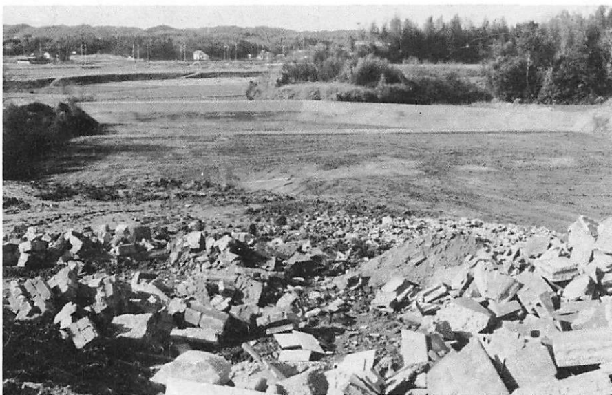
⑥ ▲旦西ガレキ捨て場