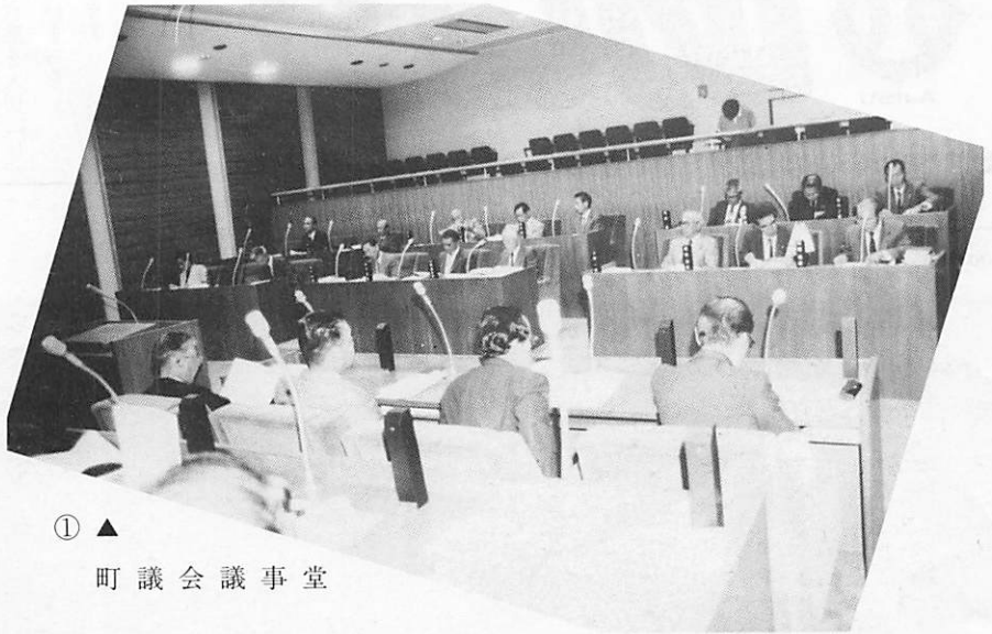
① ▲ 町議会議事堂