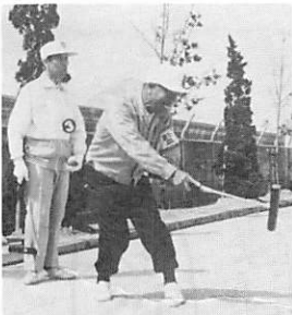
高齢者ゲートホール大会

☆五月十日 (A級) 小古郷8-7岩倉スターズ 岩倉スナイパーズ12-11阿中OB (B級) 井関0-7宮島 中村2-8鴨生原 ☆五月二十四日 (A級) 寺浜2の宮35-5向井関 飛石18-1小古郷 (B級) 沖の原13-17井関 仙在 1 宮島