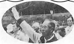
ゲートホール 大会より