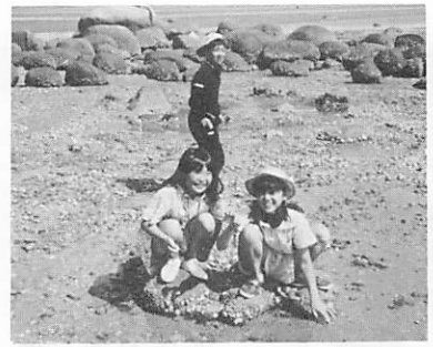
前期少年教育講座