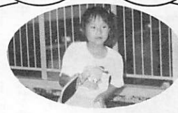
ラージホール 卓球教室