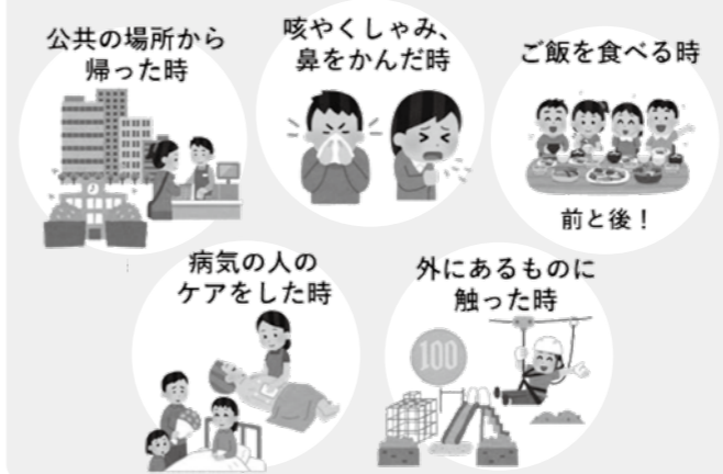
◎保健センター（健康増進課）

※応募用紙は各保健センターおよび各地域交流センターに備え付け。市ウェブサイトからも入手可。提出は各保健センターも可。