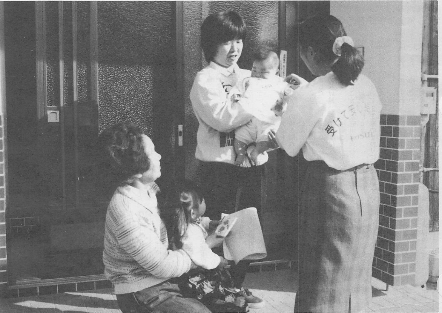
▲赤ちゃんとのふれあいの中で