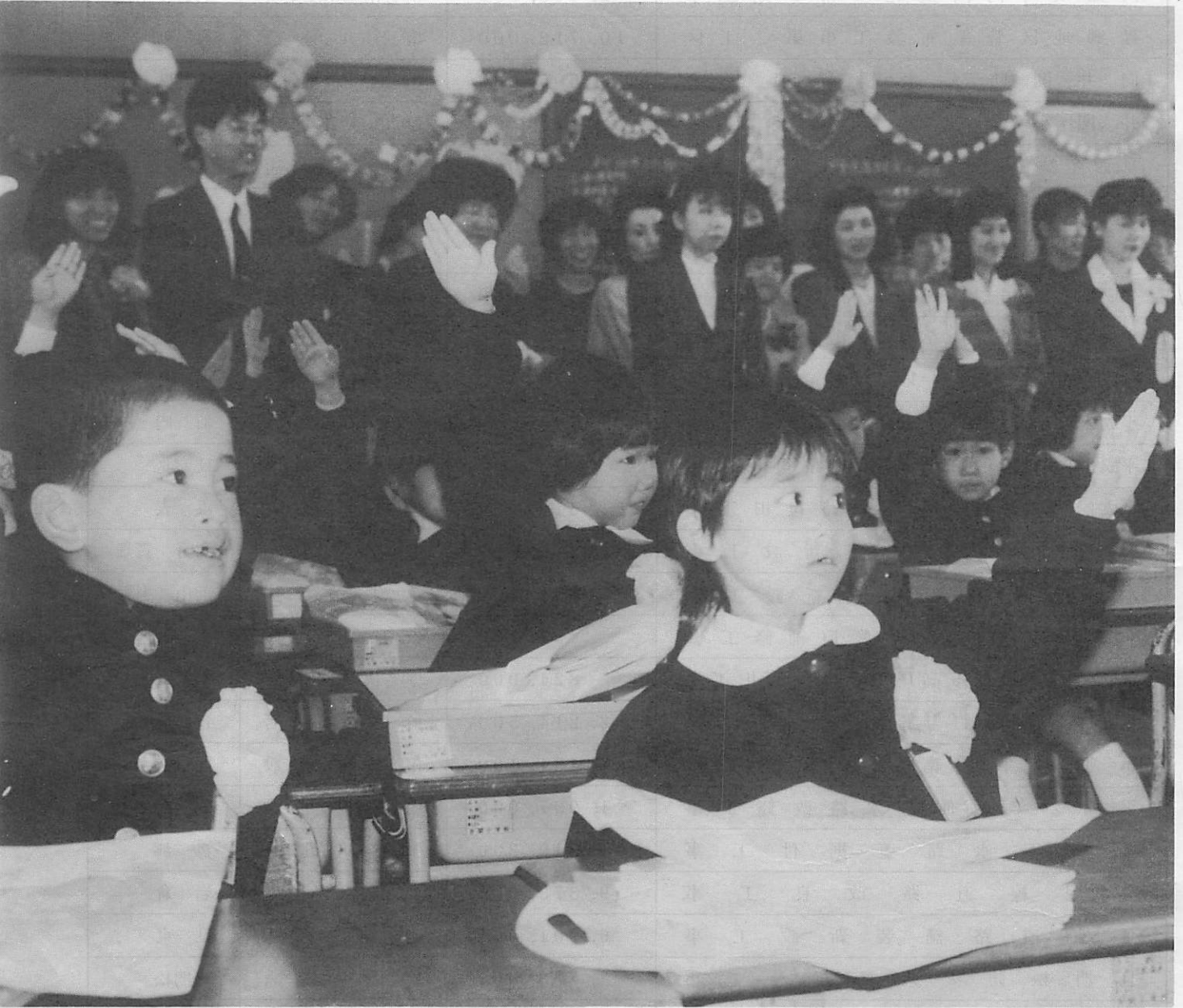
▲あげる手も元気よく(井関小)