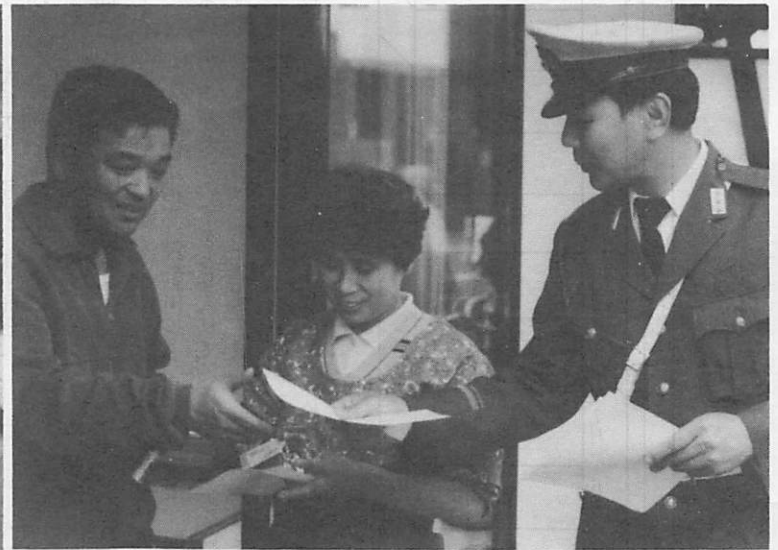
▲ご協力を……商工会員や警察官がお願い