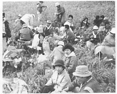
山登り同士の語らい (三瓶山)