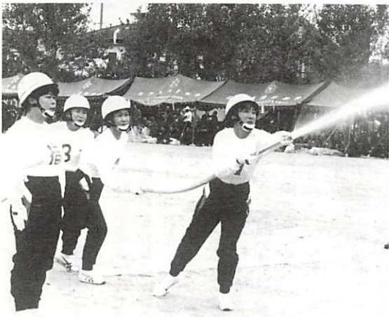
大会法操県……えて備に万