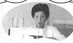
日山の園で の奉仕(婦 人学級生)