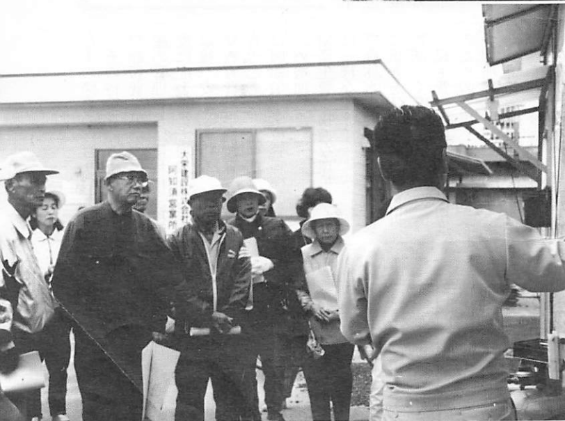
▼見る前に話を聞いて (工事事務所前で)