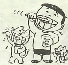
歯の衛生週間 (6月4~10日)