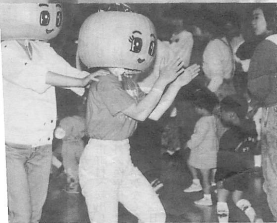
紙ひこうき飛んだ！(上) 人気もの 「元ちゃん」「気子ちゃん」