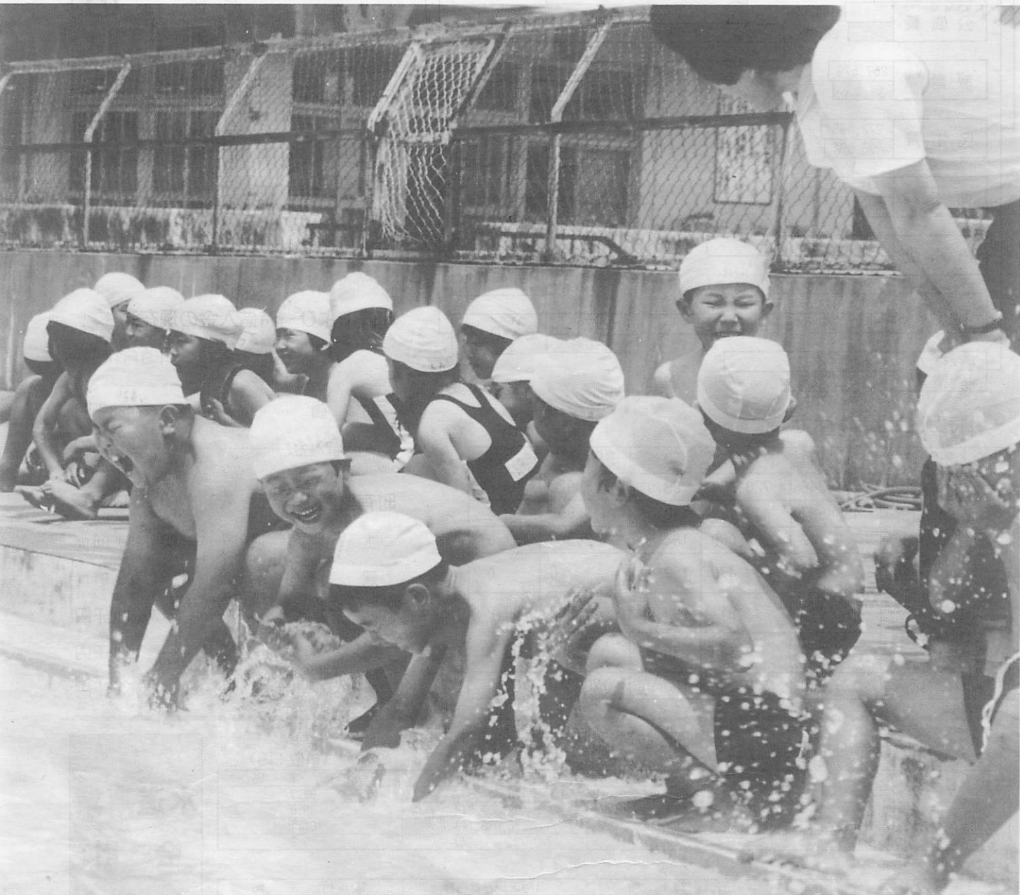
「お～ぶち冷や！」……陽気な子にも水は冷たい

広報あじす 毎月5日 発行 お知らせ版 毎月20日 発行 山口県吉敷郡阿知須町 発行 阿知須町役場 電話 65-4111(番代) ☎754-12 印刷 よしの印刷株式会社