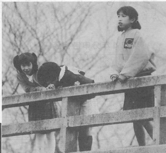
アイガモが近寄ってくるね（船渡橋）