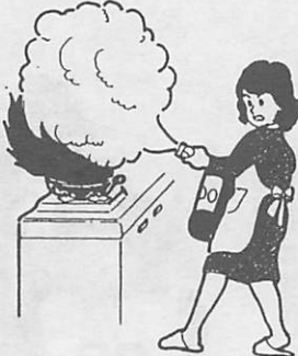
初期消火 これが決め手

有効な消火器の種類や水のかけ方など平素から考えておきましょう。消火器は粉末、強化液などがあります。家庭ではできるだけ「家庭専用消火器」を備えておくことです。この消火器は、一般的には、天ぷら油火災、電気器具やガス器具、石油ストーブからの出火などいずれの場合も使えます。