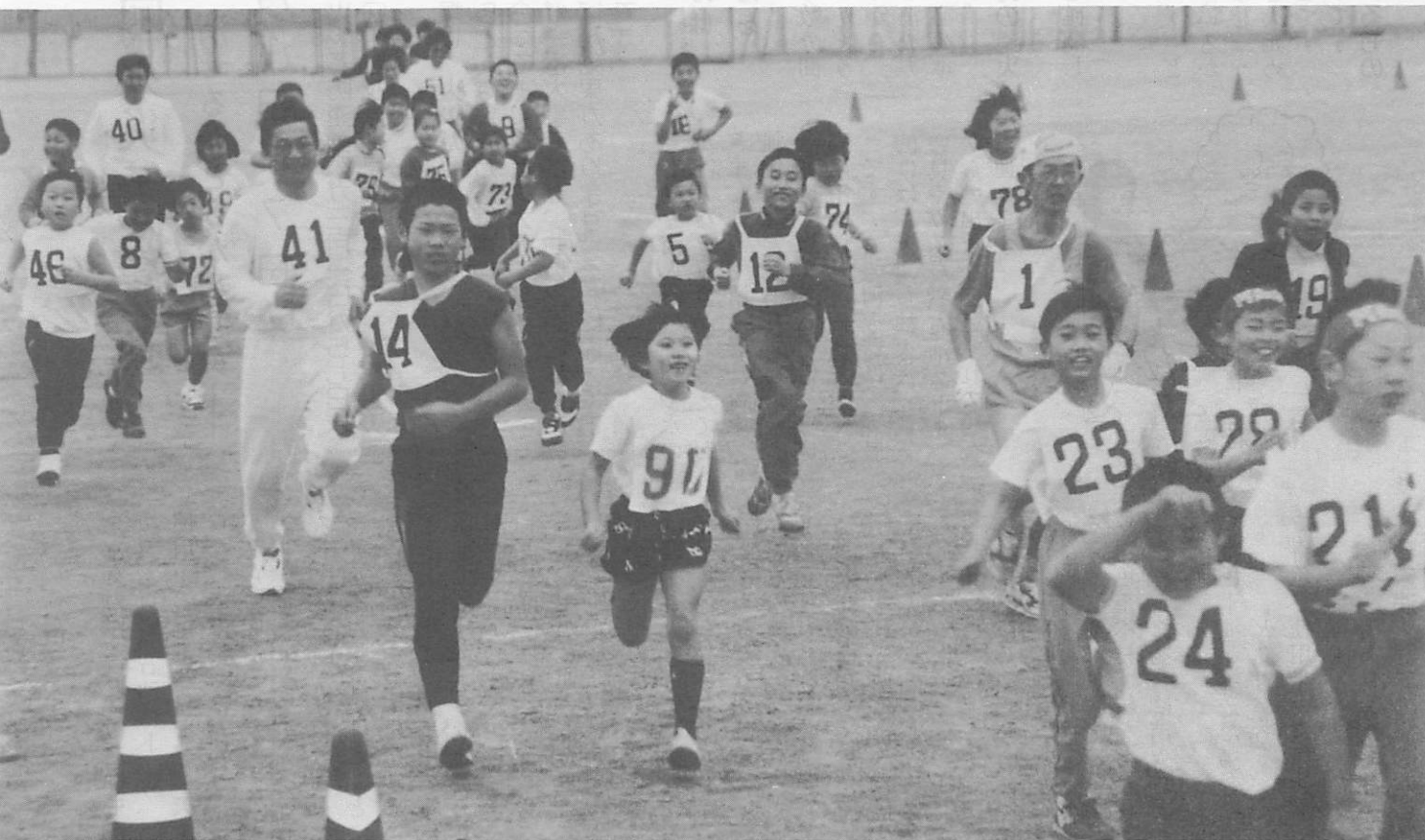
(阿中グランド2キロ、スタート)