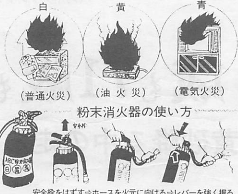
安全栓をはずさずホースを火元に向けるレバーを強く握る

▽なるべく火元に近づいて消火すること ▽煙や炎にまどわされず、火元に向かって噴射すること 粉末消火器の点検 「いざ」という時に役立つように定期的に点検しておきましょう。 ▽安全栓はついているか ▽本体や底部にサビはないか ▽ホースはヒビ割れしていないか、また、製造年月日より五年以上経過しているものは専門業者に点検してもらいましょう。