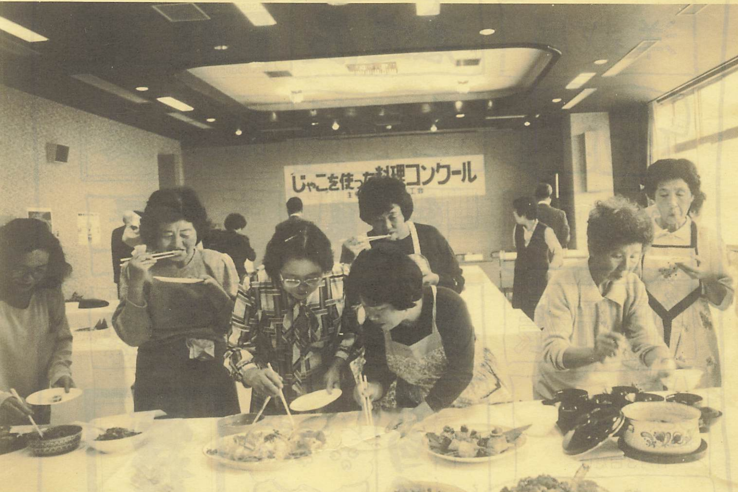
「このサラダおいしいわねー」とご満足の参加者のみなさん