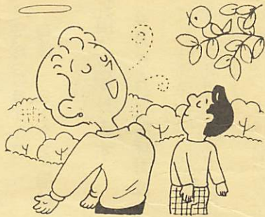
国土緑化キャンペーン