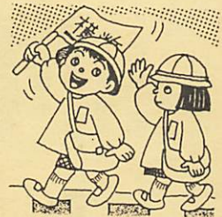
春の全国交通安全運動