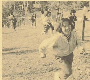
平成わんぱく講座